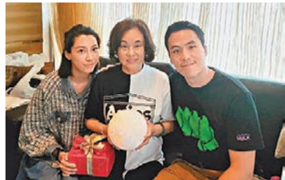
齊嬌與三太的關係亦是大眾關心的焦點。