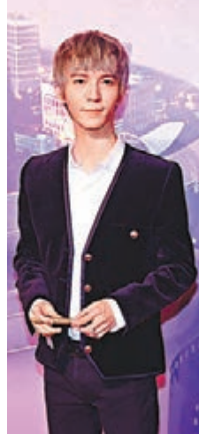
導演郭敬明表示首次拍別人的小說。