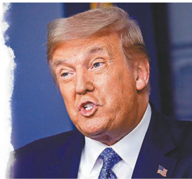
特朗普連任機會漸渺茫。