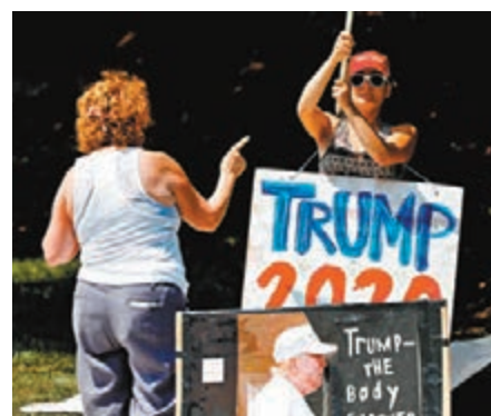
特朗普支持者與示威者對質。