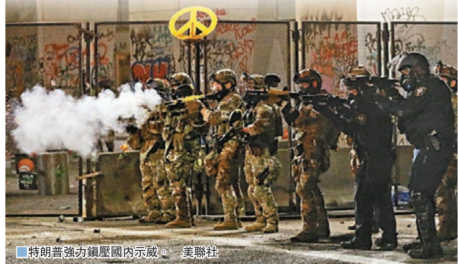
特朗普強力鎮壓國內示威。