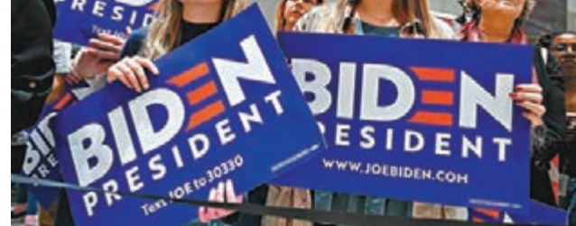
拜登3月舉行造勢集會。

支持特朗普的威斯康星州前州長沃克表示，特朗普陣營的競選策略並不清晰，不應攻擊拜登精力不足或他與民主黨左翼的關係，而應聚焦拜登過往為求當選而不擇手段的言行，形容特朗普陣營需要集中和顯示紀律，而非藥石亂投。