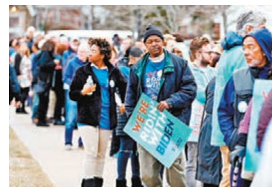
少數族裔傾向支持拜登。