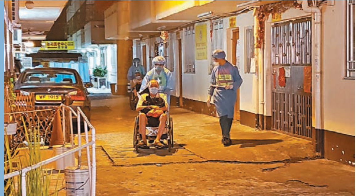
▲康和護老中心黃金分院漏夜撤離院友。