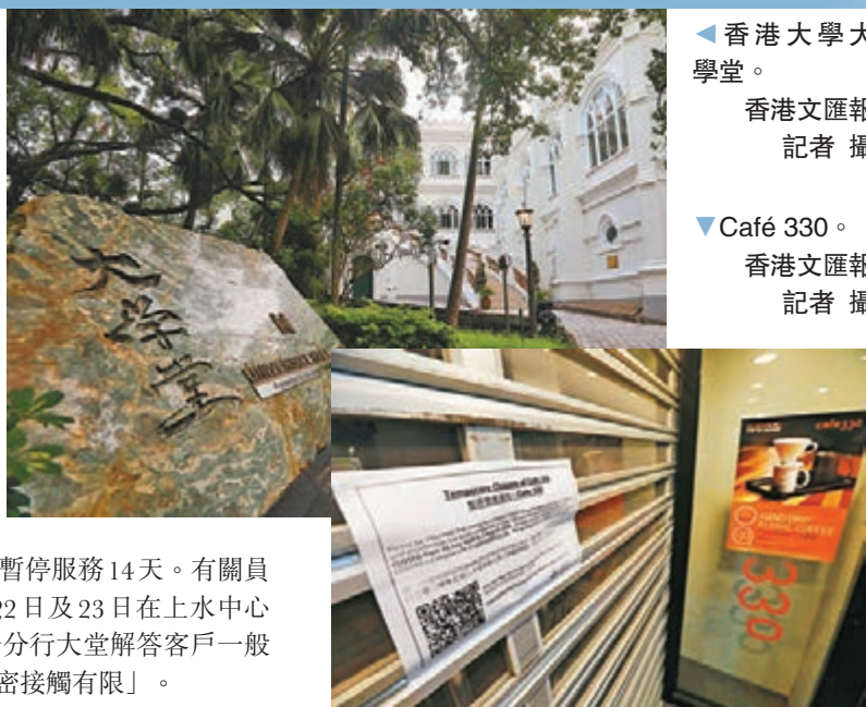
▲香港大學大學堂。

滙豐亦宣布，上水中心卓越理財中心有一名員工前日初步確診感染新冠肺炎，有關分行由昨日起暫停服務14天。有關員工於本月17日起在家工作，本月22日及23日在上水中心卓越理財中心上班，主要職責是於分行大堂解答客戶一般查詢，滙豐形容員工「與客戶的緊密接觸有限」。