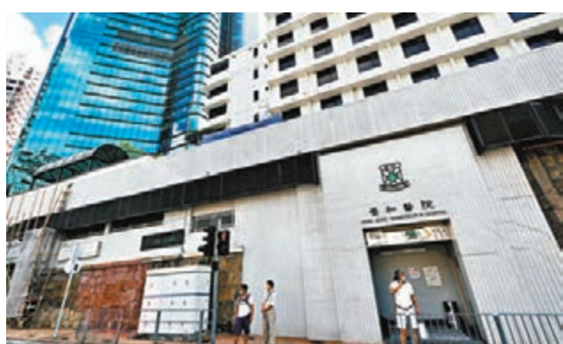
有私院要求求診及入院病人提供病毒測試陰性證明。圖為養和醫院。資料圖片

她強調，醫管局需要集中資源照顧有病徵病人，以免延誤測試、確診及治療時間，如果有太多沒有病徵者聚集在醫院，將增加感染風險，呼籲因私人理由需接受檢測的市民，到政府認可的私營醫療機構進行測試。