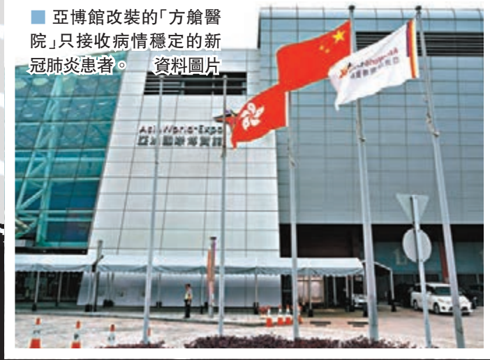
亞博館改裝的「方艙醫院」只接收病情穩定的新冠肺炎患者。資料圖片