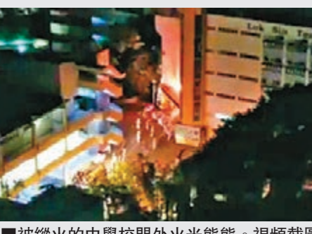
■被縱火的中學校門外火光熊熊。視頻截圖

香港文匯報訊(記者 蕭景源)攪炒黑暴無視法紀打砸燒惡行產生的「破窗效應」餘毒未清。青衣樂善堂梁植偉紀念中學繼月前被兩黑暴青年連環投擲玻璃大門，昨凌晨再遭兩黑衣人連環投擲汽油彈，一度傳出巨響及火光熊熊，消防員趕至將火救熄。警方列作「縱火」案處理，正追緝兩名黑衣人暴徒下落。 現場為青衣長康邨的樂善堂梁植偉紀念中學。今年5月，學校遭兩名黑暴青年以硬物擊碎8塊玻璃大門，目前正以木板圍封進行維修中。昨凌晨1時，學校正門位置突然傳出兩下爆響巨響，保安員聞聲趕至發現校門位置及對開花槽一片火光熊熊，兩名黑衣人急步往青衣西路方向逃去無蹤，保安員於是報警。消防員趕至射水將火救熄，初步無人受傷，經調查起火原因有可疑，轉交警方跟進。 警員到場調查，發現學校正門位置的玻璃大門、壁板、地面及天花，以至對開花槽位置也有燒過黑黑痕跡，地面遺下一樽天拿水、一罐白電池及4個小型石油氣樽等證物，懷疑有人將有關物品綁成「汽油彈」投擲縱火。案件交由葵青警區刑事調查隊第二隊跟進，追緝兩名涉案在逃黑衣人。由於該學校月前亦遭兩名青年硬物破壞玻璃大門，正調查兩宗案件是否相關。 九龍樂善堂接受傳媒查詢時表示，對轄下的樂善堂梁植偉紀念中學被投擲汽油彈事件深感憤慨，事件現交由警方調查。