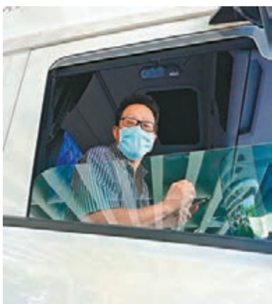
由於核酸檢測間隔時間大幅縮短，文錦渡口岸香港跨境貨櫃車排起長龍。

香港文匯報訊（記者 李昌鴻、文森）為了嚴控疫情，深圳市23日開始要求入境的香港跨境貨車司機須出具72小時內核酸檢測陰性結果證明，非特殊必要應當天往返。受此影響，深圳文錦渡口岸近日來跨境貨櫃車大排長龍，有的司機稱他為了排隊等待安排檢測已10多個小時，感覺身心俱疲。因為檢測間隔時間大為縮短和經常要排長龍，有的司機後半夜起來排隊過關。他們許多人擔心因為疫情影響了工作和生計。