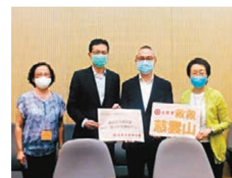
工聯會強烈要求食衛局盡快在各區設立「綜合抗疫檢測中心」。

香港文匯報訊（記者 文森）第三波疫情蔓延全港，連日來單日新增確診個案均超過百宗，其中近半源頭不明，潛藏社區大爆發風險。工聯會昨日會晤食物及衛生局副局長徐德義，要求盡快在各區設立「綜合抗疫檢測中心」，為全港市民提供防疫、檢測服務，盡快找出隱形患者，切斷傳播鏈；另外加強提供疫情資訊，以安穩「疫區」居民的情緒。工聯會會長吳秋北、榮譽會長林淑儀和陳婉嫻，連同疫情重災區居民前日會