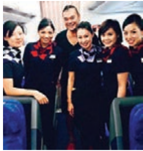
2001至2013年，港龍航空公司機組及地勤人員穿着筆者設計的制服，公司改組，從「港龍」轉「國泰港龍」，制服亦變，臨別依依，當時經常往返內地工作，高峰期一周三次，不斷被員工要求合照留念。

國，整個歐洲穿衣文化都充滿海軍藍；符合東西方穿衣文化共融。 結果港龍機組及地勤人員一穿13年，以為像新加坡航空公司制服，不會再改變已成公司Icon。可惜港龍轉名，改為Cathy Dragon，連制服都一併改變，依依不捨不單止港龍員工、長期乘客，竟然乘搭國泰航班，也被姐妹公司的機組人員向我表達抗議，大感可惜！轉換制服之前，也是在下不斷北飛的歲月，平均起碼每周兩至三趟，跟機組人員合照留念幾乎成為指定動作，深感榮幸。 當年「九鐵與地鐵」合併，從此KCR名稱歸隱，只以MTR總稱，為防其中一方員工反對影響合併進程，聘請在下設計全新概念制服。 按常規進行，自己首先大量乘搭港鐵，遊走港九各區審視乘客品味；發現黑壓壓的人群當中，明顯跳出的顏色為黃色，更是鮮黃，雖然穿上黃色衣服的人數不多，但數目穩定，醒目且安詳。決定以鮮黃及深藍兩色的組合為基礎，一種北歐、德國一團經常看到的Icon襯色，移植到香港，賦予以簡約國際品味。制服完成，MTR不斷安排在下與員工對話，解釋設計理念與內涵。際此明白，也多謝港鐵的信託；員工在云云香港設計師當中，對在下比較認識，由我這位外人（Outsider）出任橋樑，加強溝通，有利合併。感謝大眾期望，兩家公司職員順利接受新的同一套制服，在立法會順利通過。