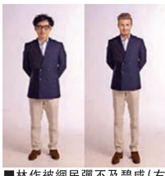
林作被網民彈不及碧威(右圖)穿得有型有品味。

包裝得更好。機器裁成的西裝，根本不能夠做到那種跟隨身材線條移動的感覺。 而穿在身上，也能頓時感覺到分別。好的西裝真的不止是牌子的問題。穿到身上，真的能感受到分別。這就是裁縫誠意的分別。 我知道再怎麼說，大家沒試過都很難能夠感受得到。但相信我，經歷如此風波，香港男人必定在下次選購西裝的時候想一想——我應該選購更名貴的嗎？我的答案是：一分錢一分貨，請你用盡你的收入儲蓄，買那麼一套頂級西裝。因為先尊重自己，別人才會尊重你。