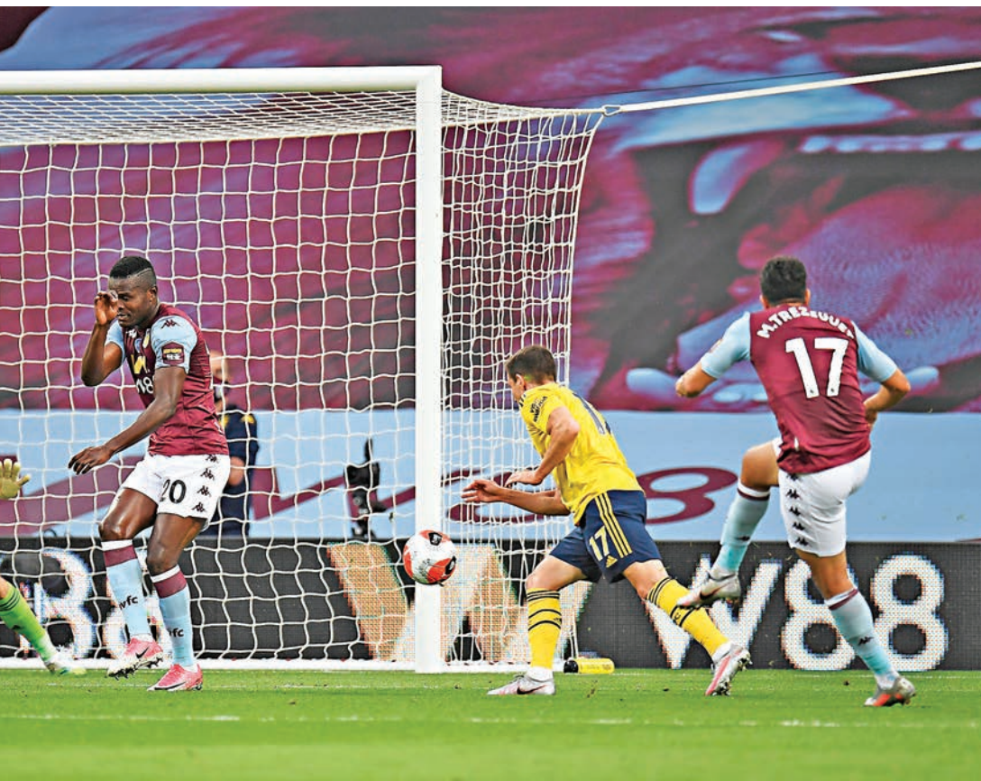
馬莫特查斯古特(右)替維拉莫勝。