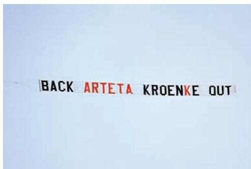
球迷以小型飛機展示反班主橫額。

對於阿仙奴近25年來首次在前六名之外完季，阿迪達承認，「對於這家球會來說這絕對是不夠好，我們在團隊及個人，很多範圍也仍需改進。」