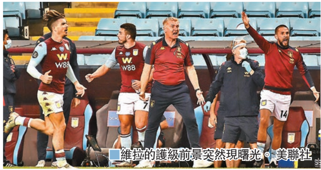
維拉的護級前景突然現曙光。

英超除了第3、4名歐聯最後一個位置之爭，最緊湊的還有聯賽榜下游的護級生死門。兩支亟待搶分求生的隊伍本輪都遇上豪門勁旅，命運卻各走極端。阿士東維拉獲阿仙奴「雪中送炭」取下重現護級曙光的3分，令到慘吞曼城4蛋的屈福特更加水深火熱。