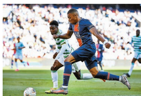
麥巴比(右)於比賽中引球推進。

連續兩季成為法甲神射手的麥巴比被視為繼C朗和美斯後的球王接班人，有指皇家馬德里十分希望簽入麥巴比代替年過30的賓施馬，不過由於疫情影響歐洲球壇收入大減，相信今夏頗難以出現這類天價收購。