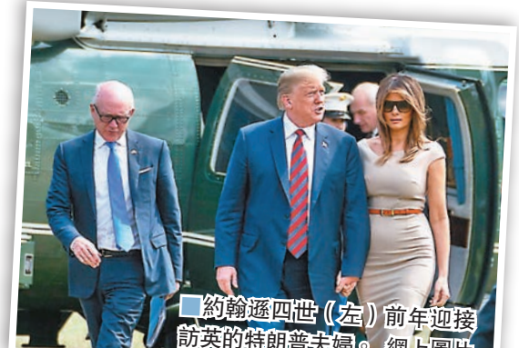
約翰遜四世(左)前年迎接訪英的特朗普夫婦。

特朗普上任後，已多次利用名下物業圖利，例如美軍在蘇格蘭過境期間，國防部便會安排部隊入住特恩伯里度假村。