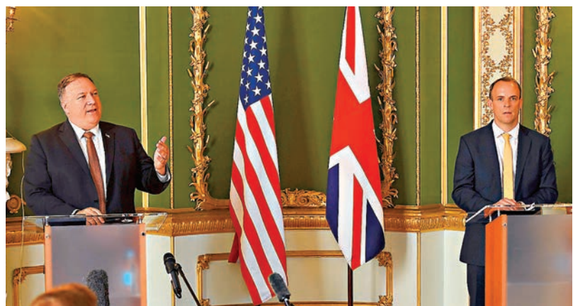
蓬佩奧與藍韜文(右)後表示，雙方曾談及香港議題。下圖為蓬佩奧乘坐的專機。