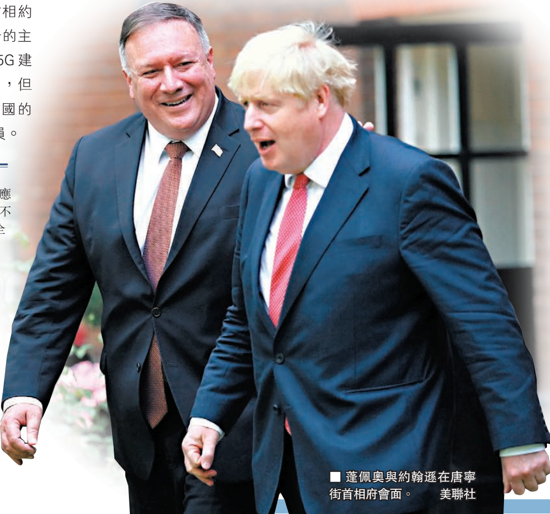
蓬佩奧與約翰遜在唐寧街首相府會面。

蓬佩奧未見約翰遜先見對華強硬派，前美國駐倫敦大使館副團長盧肯斯直言，蓬佩奧此舉不符合外交禮節，是一種就對華政策向英國政府施壓的行為。《衛報》則形容，這些對華鷹派的保守黨後座議員當中，有些也是脫歐派人士，他們在取得脫歐勝利後，正在尋找另一項「偉大事業」，即利用涉港涉疆等議題，推動英國政府在對華政策上更加強硬，並為此選擇與美國政府結盟。