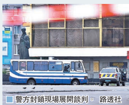
警方封鎖現場展開談判。

烏克蘭內政部長格拉申科表示，疑犯已聯繫警方，自稱為普洛霍伊，曾在社交媒體發文表達對當局不滿。當局正確認對方的身份和具體要求，總統澤連斯基在facebook留言，對發生劫持事件感到不安。 ■綜合報道