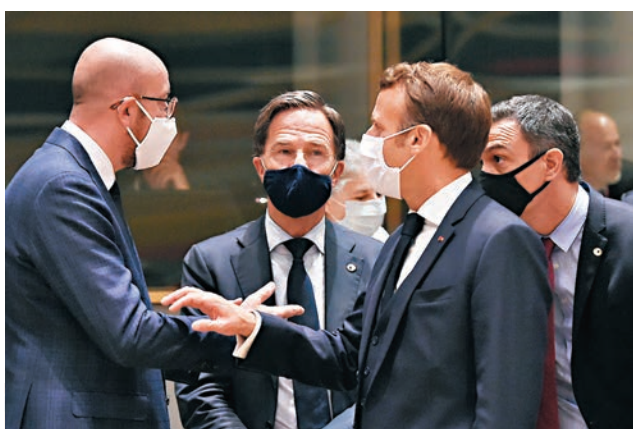
米歇爾(左一)、馬克龍(右二)、呂特(左二)會下美聯社