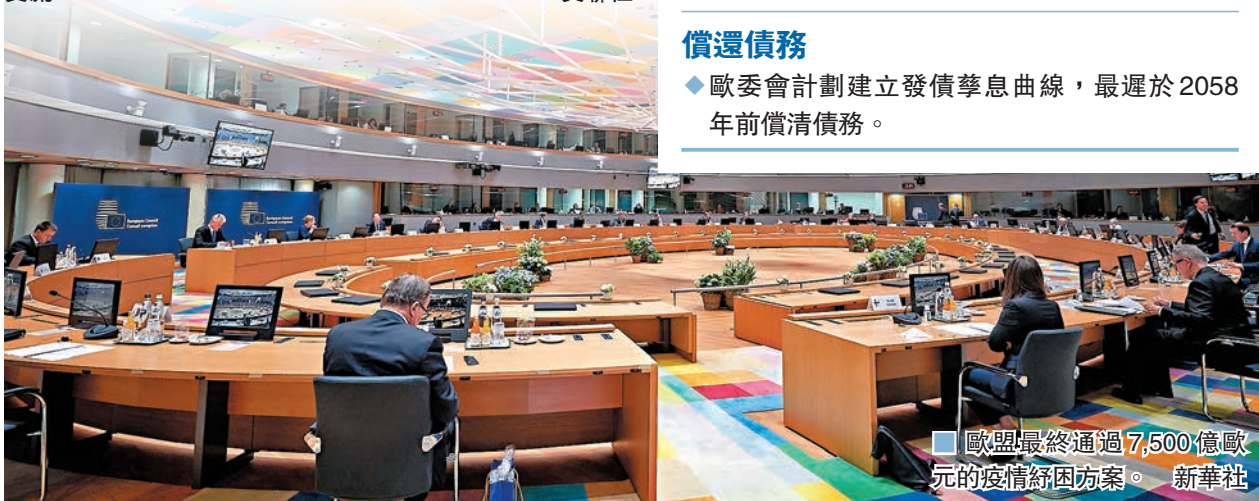
歐盟最終通過7,500億歐元的疫情紓困方案。