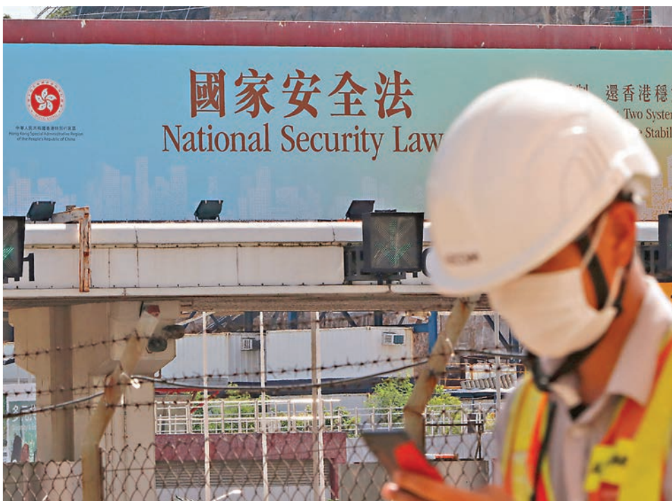
▶中國外交部、駐英國大使館、香港特區政府均批評，英方藉關注香港國安法，粗暴干涉中國內政。圖為東區海底隧道口掛有宣傳香港國安法的旗幟。 資料圖片

據中通社報道，外交部發言人汪文斌昨日在例行記者會上指出，香港事務是中國內政，任何外國無權橫加干涉。中國政府維護國家主權、安全、發展利益的決心堅定不移，全面準確貫徹「一國兩制」方針的決心堅定不移，反對任何外部勢力干預香港事務的決心堅定不移，任何干涉施壓的圖謀都絕不會得逞。汪文斌說，中方敦促英方放棄在香港延續殖民影響的幻想，立即糾正錯誤，停止以任何方式干涉香港事務和中國內政，以免進一步損害中英關係。他進一步指出，對於英方的錯誤行徑，中方將予以有力回擊。