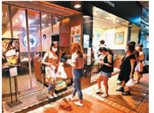
特區政府刊憲延長防疫規例,包括食肆晚市禁止堂食等措施生效至本月28日。資料圖片

有關防疫規例包括,食肆晚市禁止堂食,食客人數不得超過座位一半、同桌不得多於4人,食肆不可舉行現場表演及跳舞,以及卡拉OK及麻將活動,酒吧、遊戲機中心、健身中心、派對房間、美容院、夜店或夜總會、卡拉OK、麻將館及按摩院都要關閉。