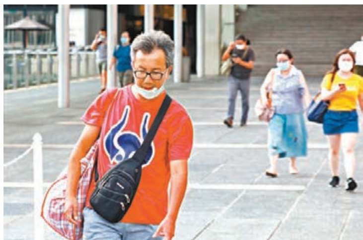
政府研究將強制公共交通工具內佩戴口罩的規例,伸展到所有室內的公共場所。圖為有市民出街不戴好口罩。