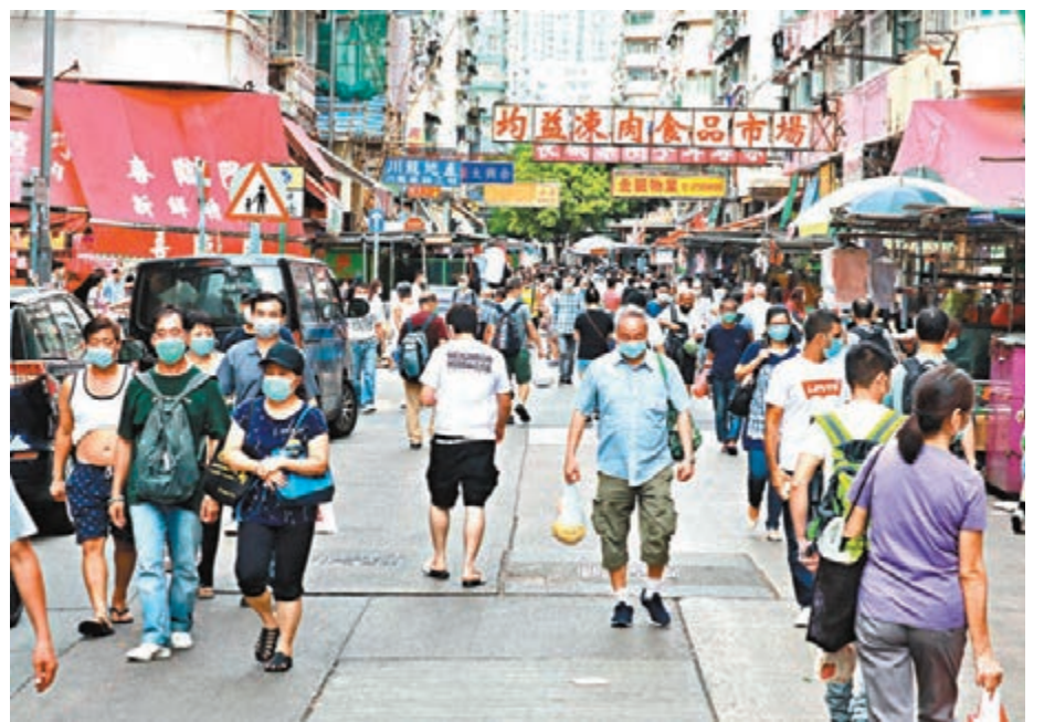
室內公共場所強制戴罩最快周內生效,其實近月不少港人已習慣戴罩出街的生活。

據了解,政府所指的室內公共場所,是指可自由進出的公共地方,例如是商場、超市、街市等。特首日前指律政司正就相關規定進行研究,或會另立一條新法例進行規管。不過,據了解,政府傾向擴大現有的公共交通工具必須佩戴口罩的防疫條例「第599I章」的適用範圍。而由上週三起,乘搭公共交通工具的乘客須強制佩戴口罩,違例者最高可被罰款5,000元。