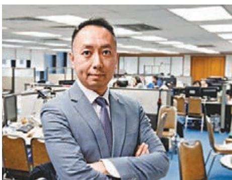
張智威稱，現在證券行已不能單靠佣金作為收入主要來源，需要積極開拓新股行展等業務。資料圖片