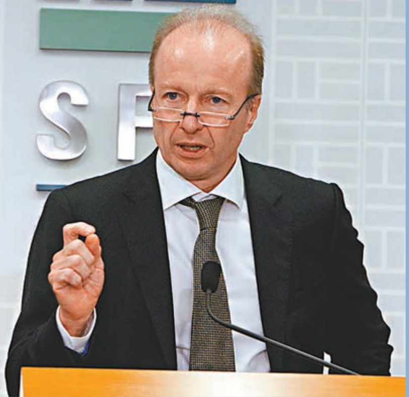
歐達禮強調，證監會將如香港國安法頒布前一樣，繼續監管香港市場。資料圖片

《香港國安法》實施三個星期，有歐洲投行計劃將新任亞洲行政總裁的辦公室由香港遷往新加坡，市場關注國安法對本港金融市場的影響。香港證監會昨發表聲明指出，與本地市場營運並活躍於國際間的金融機構對話後，並未察覺到國安法的實施會損及本港資本市場運作及制度，且港股本月上旬的日成交額大幅上升，國際投資者經滬股通及深股通的交易更是翻倍，印證香港是作為環球資金進入中國內地資本市場的重要樞紐。