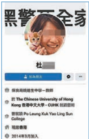
該名杜姓教師公然咒警「死全家」。

香港文匯報訊（記者 姬文風）教師對學生的影響深遠，社會各界因此對教師有較高要求，不容任何壞分子「獨」害學生。網上近日流傳，有疑似中學教師近年多次在個人facebook發表激進言論，包括以「黑警死全家」作封面照片、曾發布寫有「光復香港，時代革命」的「港獨」海報，更多次使用粗言穢語辱罵他人。事件引起不少家長關注，有人更主動向涉事學校查詢事件，獲回覆指該fb賬號屬他人假冒，該教師已就事件報警求助，並強調全體教師需恪守教職員行為守則，遵守專業，為學生提供優質的教育服務。