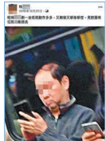
該教師曾粗言辱罵之前素未謀面的人。

爆料網民直斥這人不但鼓吹激進政治思想，甚至連一般為人師表亦欠奉，質疑對方如何為人師表。事