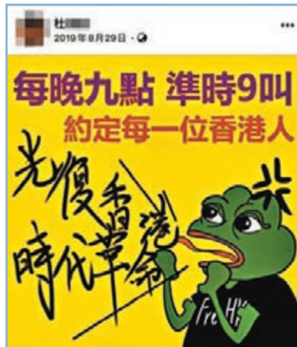
該教師曾煽動市民每晚9時高喊「港獨」口號。

香港文匯報訊（記者 姬文風）教師對學生的影響深遠，社會各界因此對教師有較高要求，不容任何壞分子「獨」害學生。網上近日流傳，有疑似中學教師近年多次在個人facebook發表激進言論，包括以「黑警死全家」作封面照片、曾發布寫有「光復香港，時代革命」的「港獨」海報，更多次使用粗言穢語辱罵他人。事件引起不少家長關注，有人更主動向涉事學校查詢事件，獲回覆指該fb賬號屬他人假冒，該教師已就事件報警求助，並強調全體教師需恪守教職員行為守則，遵守專業，為學生提供優質的教育服務。