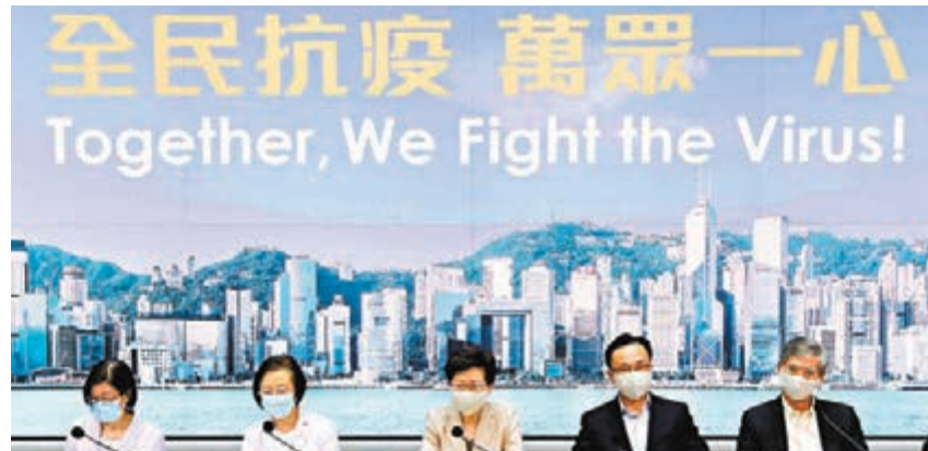
行政長官林鄭月娥率領幾位局長舉行記者會，宣布政府收緊防疫五措施。

近日確診病例急增，昨日更單日增加逾百名確診者。圖為聖德肋撒醫院，有穿着整套防護衣物的人員為出入醫院的人士量度體溫。