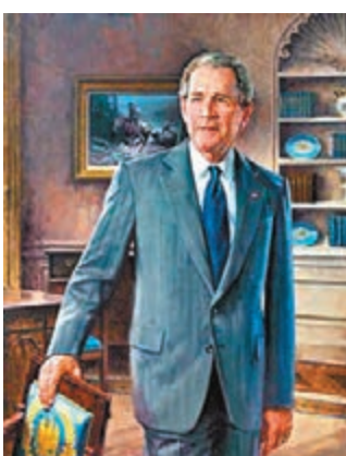
■ 布什與克林頓(右圖箭嘴)的肖像原本掛於白宮大廳。