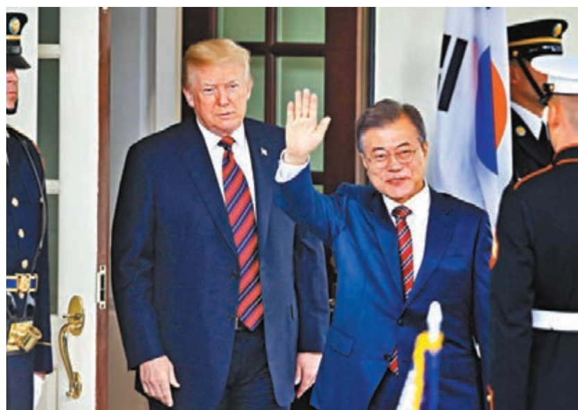
■ 特朗普被指非常討厭跟文在寅(右前)打交道。圖為兩人前年在華盛頓會晤。資料圖片