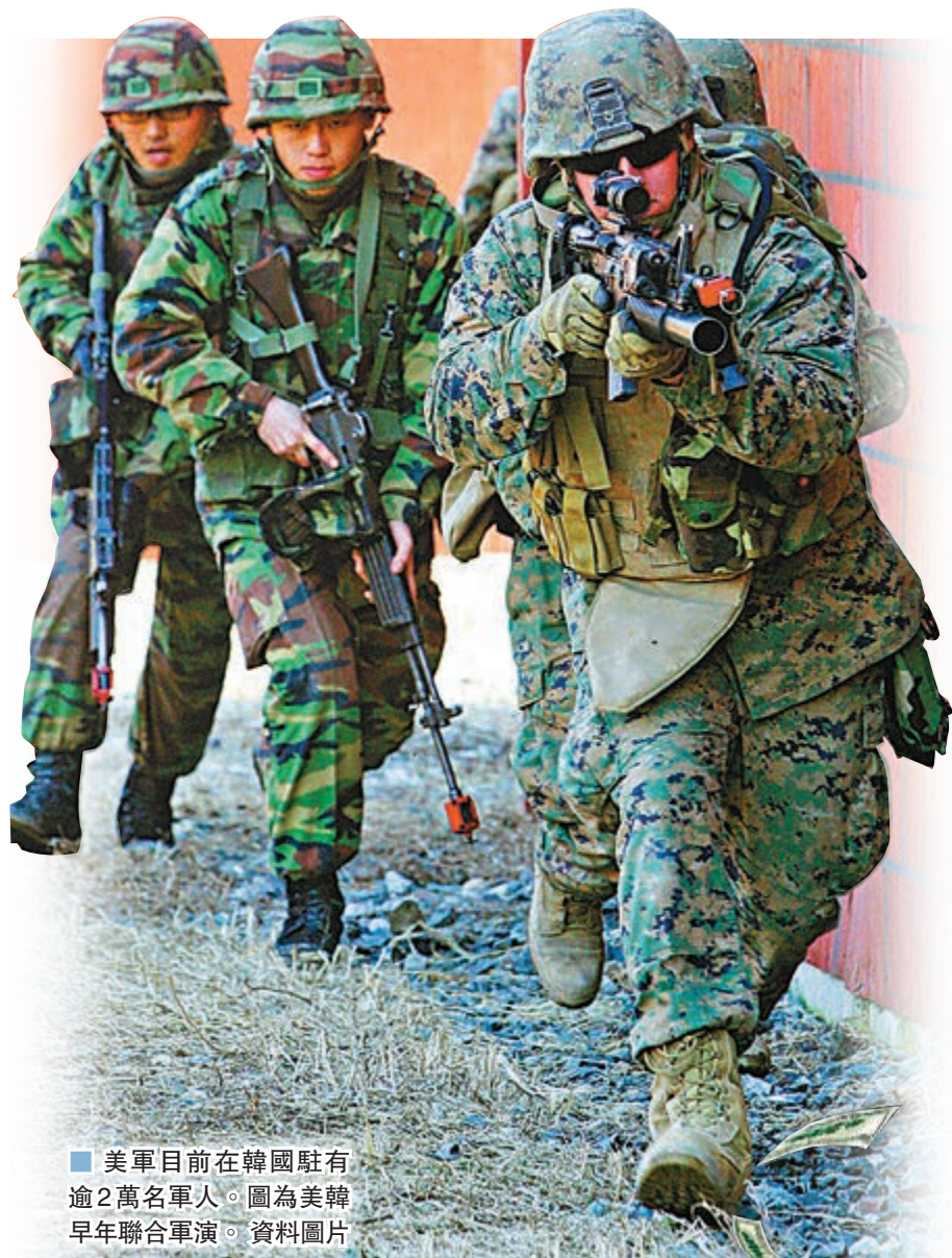
■ 美軍目前在韓國駐有逾2萬名軍人。圖為美韓早年聯合軍演。