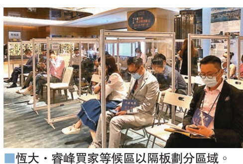
恆大·睿峰買家等候區以隔板劃分區域。

該盤昨日發售的83伙，發展商維持最高12%折扣，昨10時安排A組大手買家到場揀樓，現場消息指，開售首2小時已沽約21伙。據悉，最大手有兩組客各購4伙，涉資約7,000萬元。其中一組本地家庭客斥資約3,600萬元購入4伙A、H單位，面積分別317及446