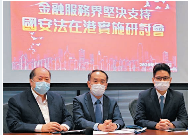
許正宇(中)認為，香港國安法對香港作為國際金融中心的持續發展十分關鍵。左一為張華峰。

香港文匯報訊 金融服務界昨舉行網上研討會，中銀國際、海通國際、中國人壽海外等眾多金融機構的代表及業界人士，堅定支持國安法在港實施，紛紛表示國安法為金融業界創造安全有序的經營環境。財庫局局長許正宇出席研討會時表示，自從《香港國安法》實施以來，本港金融市場運作平穩有序，認為香港國安法對香港作為國際金融中心的持續發展十分關鍵。