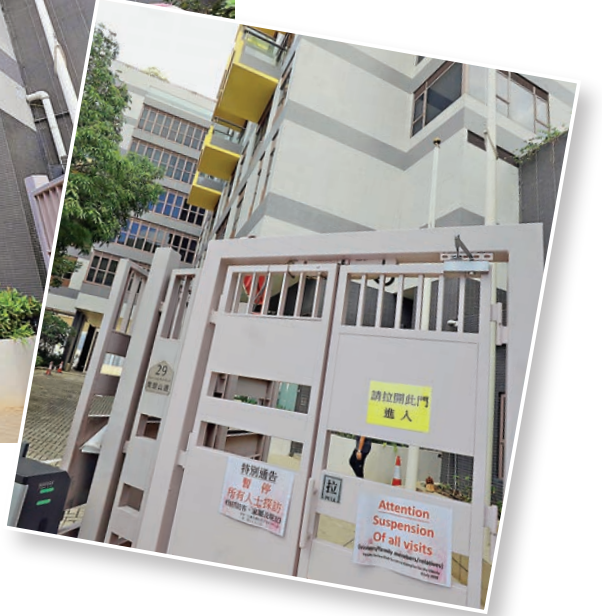
綜合中心門外貼出暫停探訪告示。