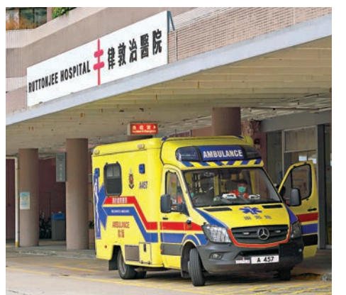
一名71歲女病人16日晚因心臟停頓送往律敦治醫院搶救，於昨日下午離世。資料圖片