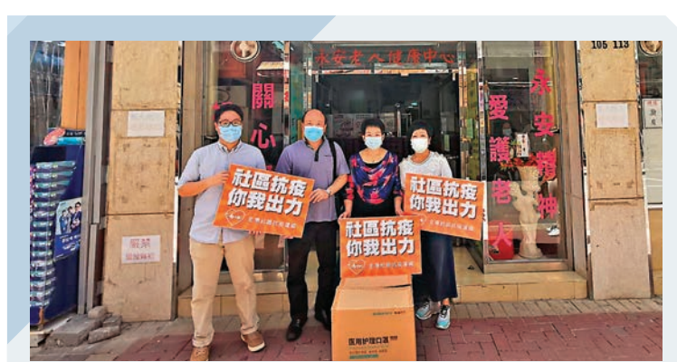
送物資助抗疫 安老院疫情亮紅燈，全港社區抗疫連線早前已推出「安老院舍抗疫物資支援計劃」，有關的抗疫物資正陸續運送和派發中，爭取能夠及時送到有需要的院友和職員手上。

版的員工可獲公司安排接受病毒檢測，至於同層其他部門員工則未有同類安排。投資理財版的辦公室位於北角利達大廈2期7樓。《經濟日報》表示該名員工工作所在樓層已全面消毒，同層其他同事已獲安排在家工作，公司會密切留意事件發展，採取相應措施。另外，該報表示，已提醒各樓層員工在辦公室範圍必須戴上口罩，減低除下口罩機會，以及切勿進行跨樓層活動，同時要保持適當社交距離，勿聚集進餐。