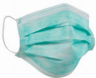
■口罩大小要適合自己。