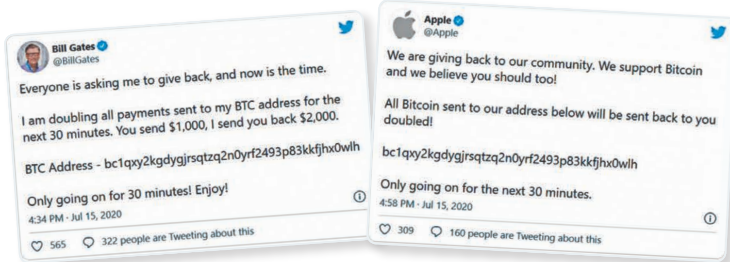
蓋茨和蘋果公司等名人及大型企業的賬號被黑客入侵，發布詐騙比特幣的帖文。