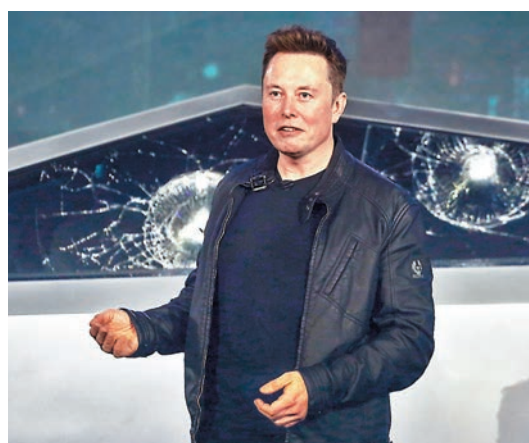
騙徒2018年在twitter假冒馬斯克，誘騙網民的比特幣。資料圖片

twitter 前日受歷來最大規模入侵，暴露嚴重保安漏洞，twitter 在被入侵的兩個多小時看來亦無法招架，任由黑客魚肉。有科技網站警告，事件未來將成為全球網絡安全隱患，一旦有國家級黑客模仿這入侵手法，造成的混亂將難以想像。