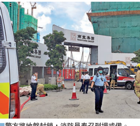
警方將地盤封鎖，消防員奉召到場戒備。

香港文匯報訊（記者 蕭景源）九龍灣啟德沐元街一建築地盤發現戰時巨彈，昨午有地盤工人進行工程期間，在離開地面約10米深泥土中發現一枚約1米長、直徑約30厘米的戰時炸彈，立即停工及通知主管，爆炸品處理人員到場證實炸彈處於極不穩定狀態，須緊急封鎖地盤處理，港鐵啟德站亦受影響要臨時關閉，由於引爆需時，為策安全，至深夜地盤以及附近屋苑「啟德一號」共逾2,000人要疏散，部分居民要由旅遊巴載往啟德社區會堂暫避，拆彈工作通宵進行。 現場為啟德協調道和沐元道交界南豐集團一個地盤，正興建一條通往啟德苑的行人隧道。昨午2時許當工人發現該枚戰時炸彈後，經警方爆炸品處理人員到場評估風險，已即時疏散附近約1,200名市民，警員又將現場一帶封鎖，消防員亦奉召到場戒