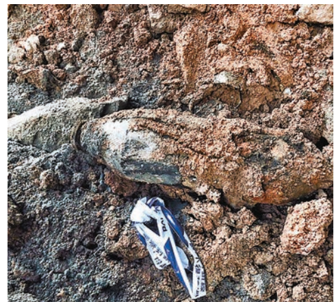
地盤發現的戰時炸彈。