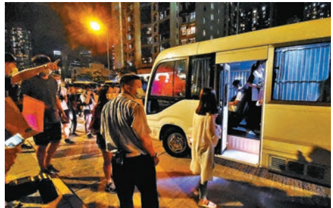
「啟德一號」疏散的居民由旅遊巴載往社區會堂暫避。