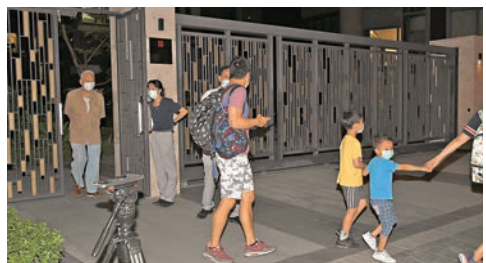
「啟德一號」部分面向地盤方向的單位居民要疏散。