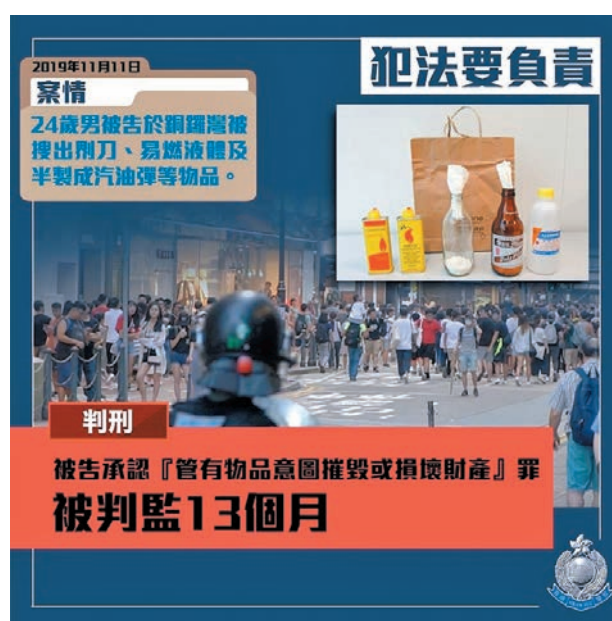
補習老師藏鋸刀及半製成汽油彈，被判囚13個月。

被告慶幸「警方及時挽回」 辯方前日及昨日求情稱，被告畢業於皇仁書院，在公開考試獲優異成績並入讀中文大學醫學院，但其後因抑鬱症而轉讀翻譯系，及後更退學，案發前以教鋼琴及補習維生。被告稱不能接受自己的行為，當時誤入歧途但「幸好警方及時挽回」，現明白暴力不能令社會變好，已深刻明白過錯，不會重蹈覆轍，並對家人感歉意，會盡力報答他們。 裁判官鄭紀航指出，本案涉案的物品雖然只能製造兩個汽油彈，但不能忽視剩餘的易燃液體及打火機可用以縱火，控罪嚴重，必須判處阻嚇性刑罰，以保障大眾的安全及財產免受侵害，遂以18個月監禁為量刑起點，考慮到被告在開審前認罪、沒有案底及其求情內容等因素後，判他監禁13個月。