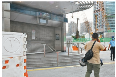
港鐵啟德站要臨時關閉暫停服務。

因疏散的居民眾多，直到晚上10時許，現場仍在疏散中，大批居民由旅遊巴載往啟德社區會堂臨時安置，其間有工作人員派發樽裝水及零食等乾糧，而進入會堂的居民都要測量體溫。 據悉，至午夜前，現場一帶疏散的居民加上日間疏散的地盤工人，合共逾2,000人被疏散。