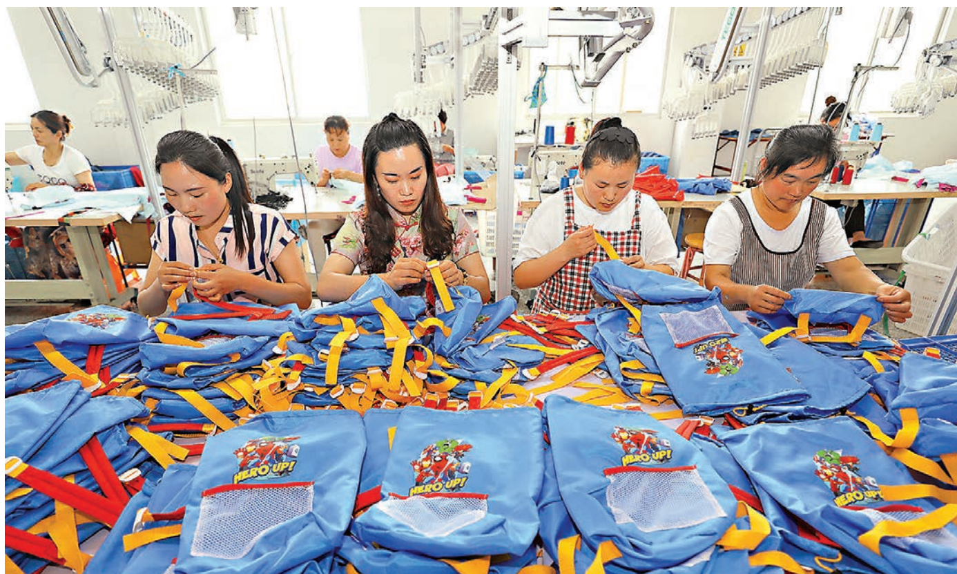
隨着內地疫情防控形勢向好，生產生活陸續恢復，宏觀政策持續發力，2020年二季度GDP由負轉正，同比增長3.2%，明顯高於市場預期。圖為6月20日，工人在江蘇省連雲港市贛榆區班莊鎮的一家旅遊戶外用品企業生產線上加工出口產品。 資料圖片