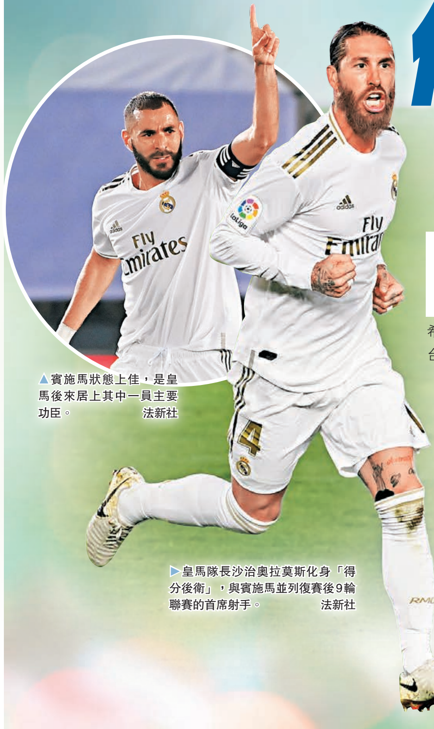
▲賓施馬狀態上佳，是皇馬後來居上其中一員主要功臣。