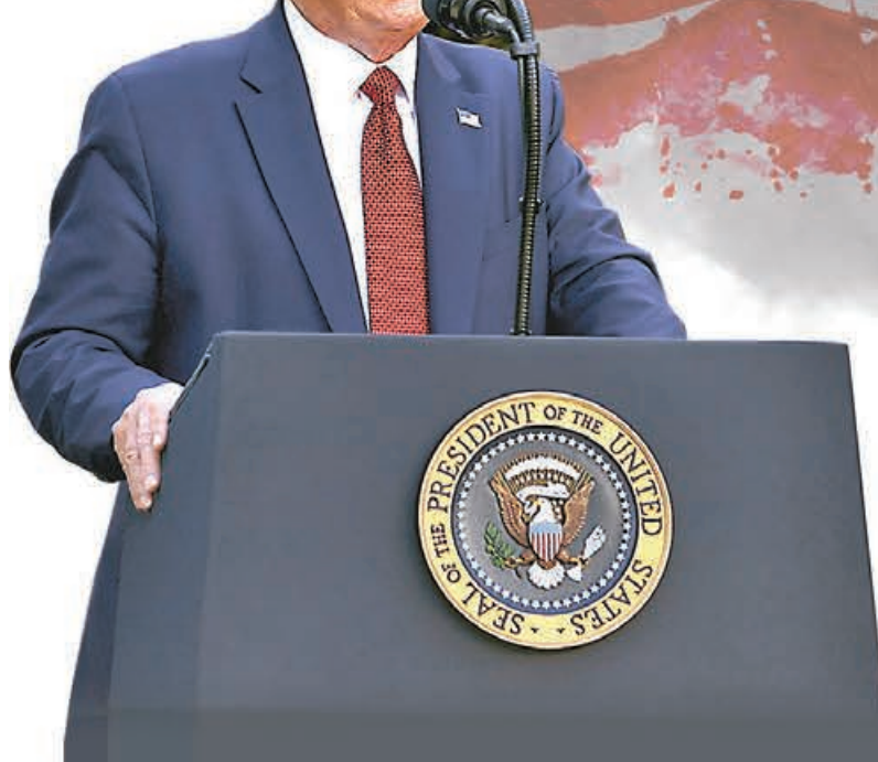
■ 特朗普早前宣布「香港自治法案」簽署成法。