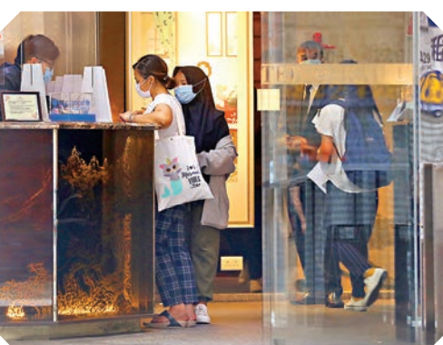
外傭抵港後須按規定到酒店、賓館隔離檢疫。

在香港文匯報記者走訪期間，亦發現所有這些賓館都沒有為客人量度體溫，即使在記者付款入住後，職員也沒有度體溫。不僅如此，記