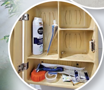
賓館提供簡單的梳洗用品，包括非一次性用品。