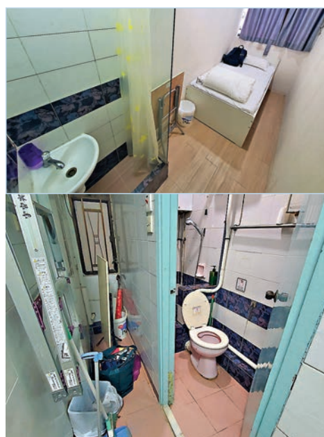
部分房間只提供洗手設施(上圖)，如廁要用衛生環境一般的公用廁所(下圖)。

沙咀美麗都大廈共有5間賓館在勞工處所提供的名單上，香港文匯報記者走訪該些賓館，向前台人員確認此處是否有隔離檢疫人士入住，對方不諱言說：「有！」記者遂說：「我唔係檢疫人士，都可以入住嗎？」職員殷勤地說：「放心，雖然你與檢疫人士同層，但你間房隔壁幾間都無隔離人士。」