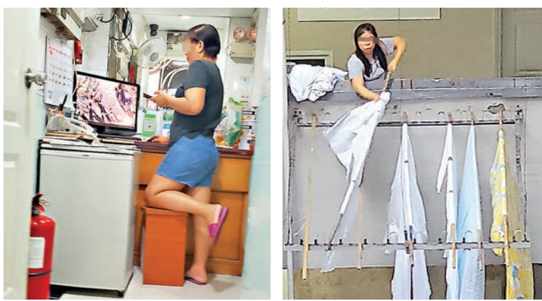
賓館的被鋪只使用洗衣機清洗，未見有特別的消毒程序。

賓館沒有提供膳食，香港文匯報記者傍晚向賓館職員查詢：「隔離人士如何醫肚？」職員回答：「佢哋自己叫外賣，會送上來。」記者在大廈附近巡視，的確見到不少只戴口罩的外賣員進入大廈內，記者尾隨其中一名外賣員到賓館房間。該名只有口罩但毫無其他保護裝備的外賣員，向其中一間房敲門，不久有戴上口罩、右手插褲袋遮住電