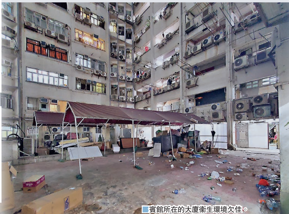
賓館所在的大廈衛生環境欠佳。