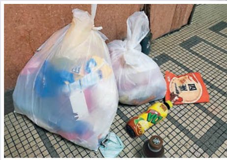
賓館所在的大廈走廊，垃圾隨處棄置。