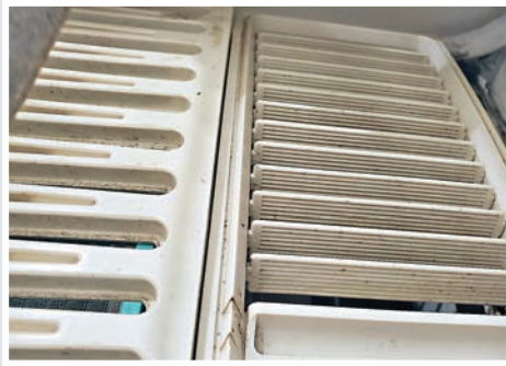
冷氣機出風口的塵埃。

2020年7月 16 星期四 庚子年五月廿六 初二大暑 大致天晴 天氣酷熱 氣溫29-33℃ 濕度60-85% 4 89 7001 3 6001 3 港字第25681 今日出紙3疊8大張 港售10元