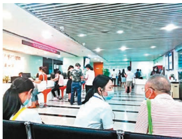
因牛市來臨許多投資者前往證券公司開戶，有人通過場外配資加大投資額。