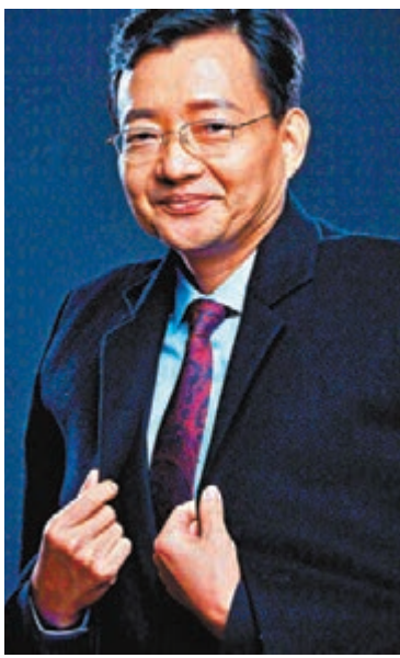
李大霄表示，牛市時期很多投資者為了博取高收益都採取高槓桿的方式。資料圖片

他說，2015年上半年，因為大量投資者加槓桿，A股市場從牛市變成了「瘋牛」，當年5月份隨着清查場外配資，股市泡沫被刺破，出現了2015年下半年的暴跌。為了防止再次出現槓桿過高導致的風險事件，最近中證監公布了250多家場外非法配資平台的名單，向投資者提示風險，銀保監會也要求嚴查違規資金入市。此舉將有利於防止催生資產泡沫，讓A股市場走出健康牛市。