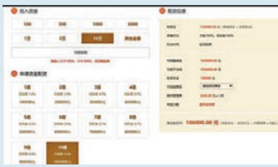
深圳一配資平台給投資者介紹配資方法和步驟。