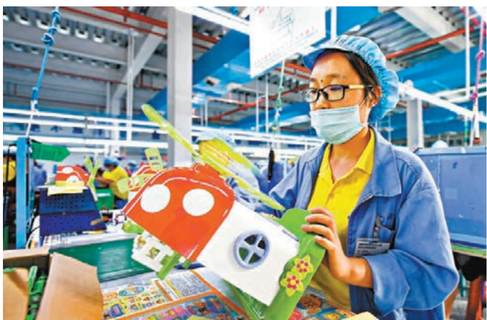
進出口年內首現雙增長。圖為日前工人在張家界一間廠房內檢查生產的玩具。

香港文匯報訊（記者 周琳 北京報道）中國海關總署昨日公布的最新數據顯示，6月份中國出口額同比增長4.3%，自4月份以來連續三個月增長；進口增長6.2%，年內首次雙雙實現正增長。海關總署新聞發言人李魁文在昨日的發布會上稱，上半年中國外貿進出口整體表現「好於預期」。