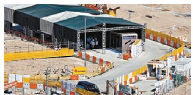
首批約800個單位的工程已接近尾聲。