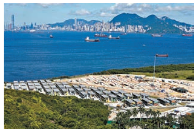
耗資1.9億，位於竹篙灣迪士尼樂園停車場側的檢疫中心只建成一半，尚有另一半空地還在地基工程階段。 香港文匯報記者攝