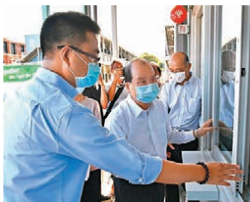
張建宗了解竹篙灣新檢疫設施興建進度。

在疫情升溫下，政府會否擱置歸還駿洋邨的計劃？林鄭月娥昨日解釋，駿洋邨已被徵召幾個月，影響多個公屋家庭，尤其公屋家庭有小朋友，其學校是揀選在駿洋邨附近，希望可用更體恤的做法讓準公屋戶盡快「上樓」，故政府已發