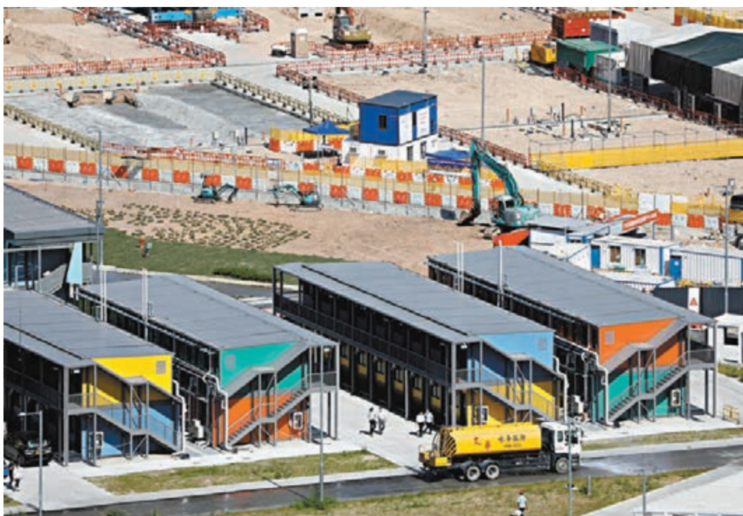
多個組合屋已井然有序排列，部分更已安裝基本水電裝置。