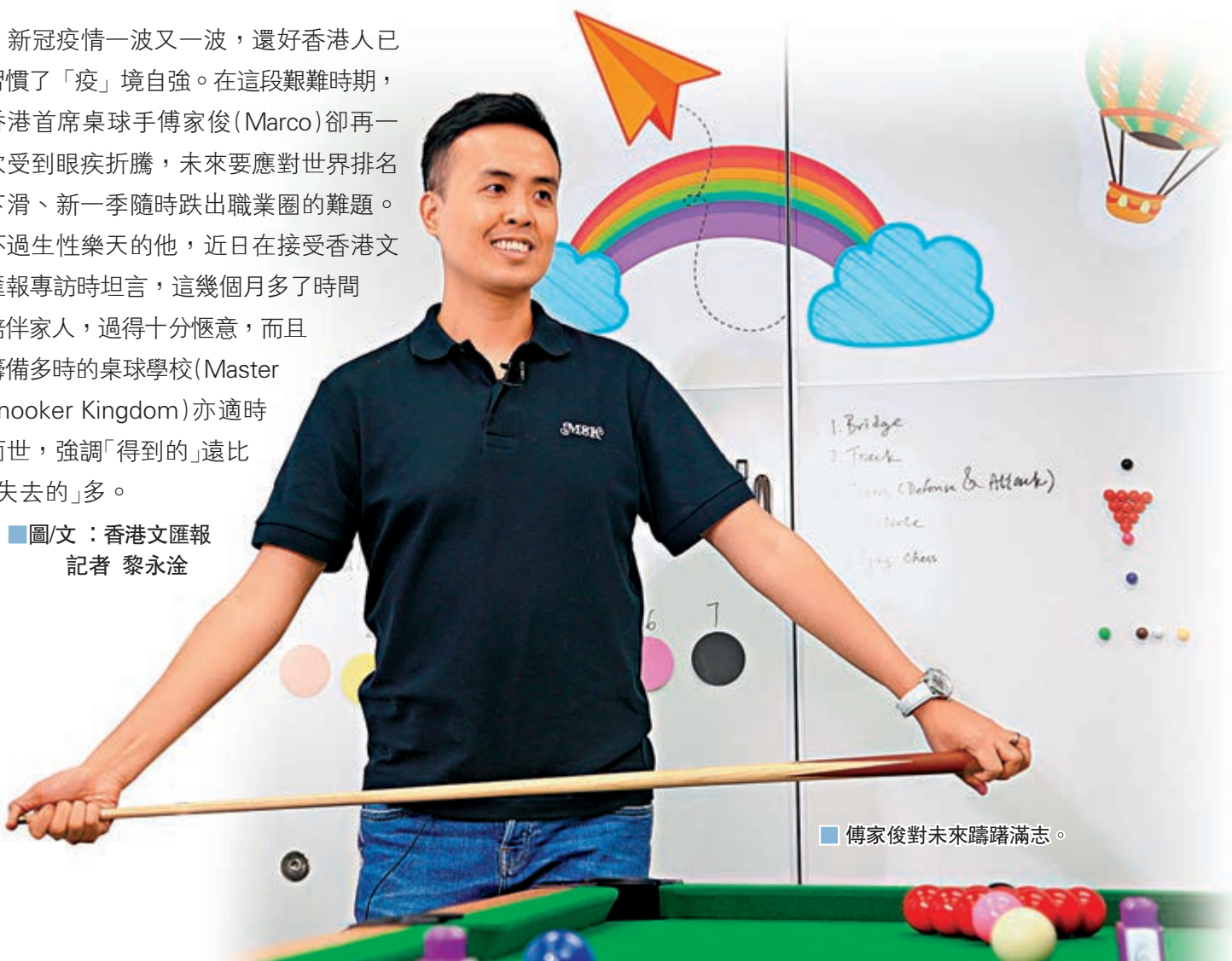
傅家俊對未來躊躇滿志。