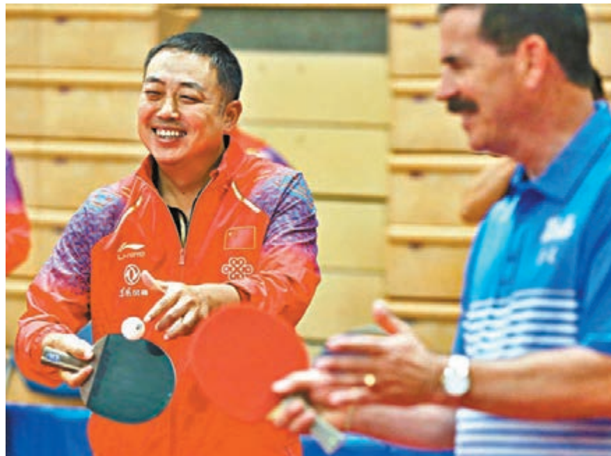
中國乒協主席劉國梁希望內地於8月恢復乒乓球比賽。