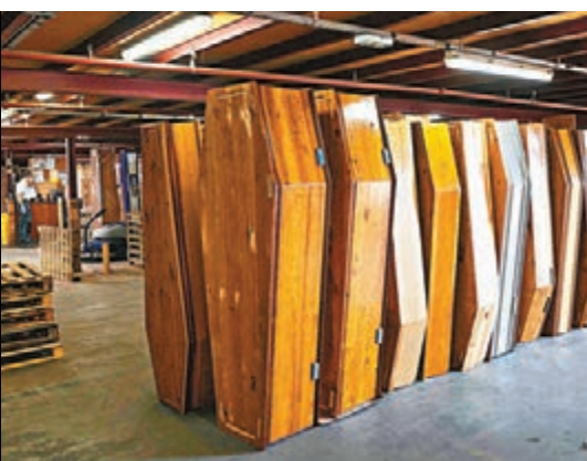
法國疫情反彈，殯儀館準備棺材應急。