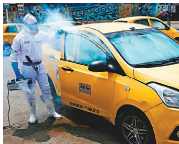
世衛稱只要全球大眾加強消毒、食肆遵守防疫措施等，疫情仍有可能受控。