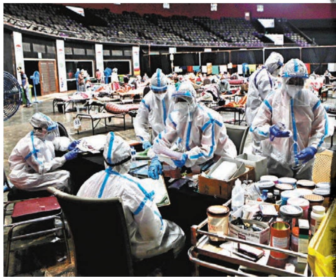
全球新增病例主要来自美國、印度等地。圖為孟買醫護在隔離設施工作。

全球新冠肺炎疫情出現反彈跡象，據世界衛生組織統計，全球前日新增逾22萬宗確診病例，創疫情爆發以來單日新高，累計病例在6周間增加一倍。疫情逐漸步向失控，世衛總幹事譚德塞則表示，多國經驗顯示只要防疫措施足夠嚴厲，疫情仍有可能受控，其他官員亦提醒各國不能「盲目解封」。