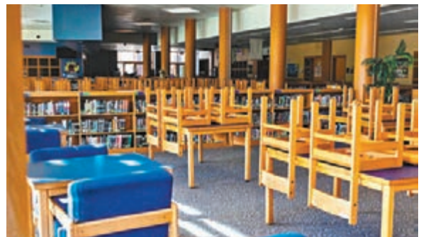
佐治亞州學校仍然停課。

部分共和黨人亦反對特朗普的做法，馬里蘭州州長霍根直言「我們不會被總統欺負或威脅」。俄亥俄州州長德維恩亦表示，州政府將根據當地疫情狀況，決定學校重開的最佳方案。 ■美聯社路透社