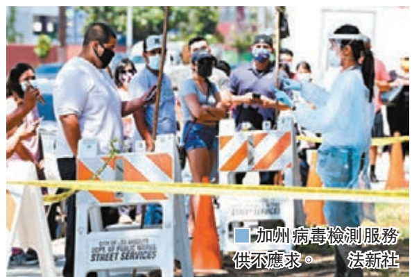
加州病毒檢測服務供不應求。

拉丁美洲疫情繼續惡化，巴西衛生部前日公布，當天再錄得4.5萬宗確診及1,200宗疫斃個案，累計逾180萬宗確診，僅次於美國，累計死亡人數更升穿7萬，達到7.04萬人。 ■綜合報道