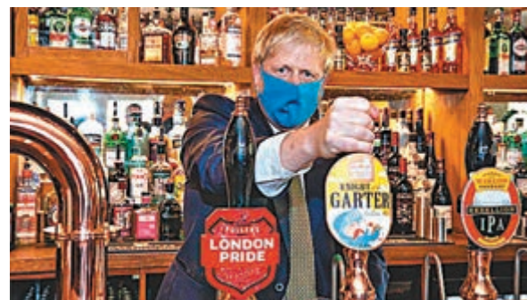
約翰遜戴罩現身。

英國首相約翰遜前日暗示，政府可能會強制英格蘭地區的民眾，在商店等密閉空間內佩戴口罩，並一改他之前呼籲國民在家工作的建議，認為現在是時候盡可能重返工作場所辦公，從而重啟經濟。由於內閣官員因未有樹立戴罩的榜樣而飽受批評，約翰遜前日以身作則，在巡視商店時首次公開戴罩。英格蘭目前僅規定在乘搭地鐵等公共交通工具時需佩戴口罩，蘇格蘭自前日起則規定在進入商店時必須戴罩。英國政府起初認為口罩的防疫效果「微弱」，即使在4月份仍堅持只有前線醫護才需佩戴。然而約翰遜在5月逐步解封後一改口風，稱戴