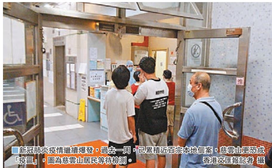
新冠肺炎疫情繼續爆發，過去一周，已累積近百宗本地個案，慈雲山更恐成「疫區」。圖為慈雲山居民等待檢測。

張竹君坦言，全港疫情正在爆發中，慈雲山由於食肆及人流眾多，問題更明顯。她又認為，如果市民感染控制意識不足，仍參與聚會、補習等活動，未來可能爆發情況會更嚴重。中心正調查源頭和做檢測，亦希望市民盡量在家工作及減少人群聚集，令到本港可以控制疫情。若參加書展，希望市民戴好口罩，做好防疫措施。