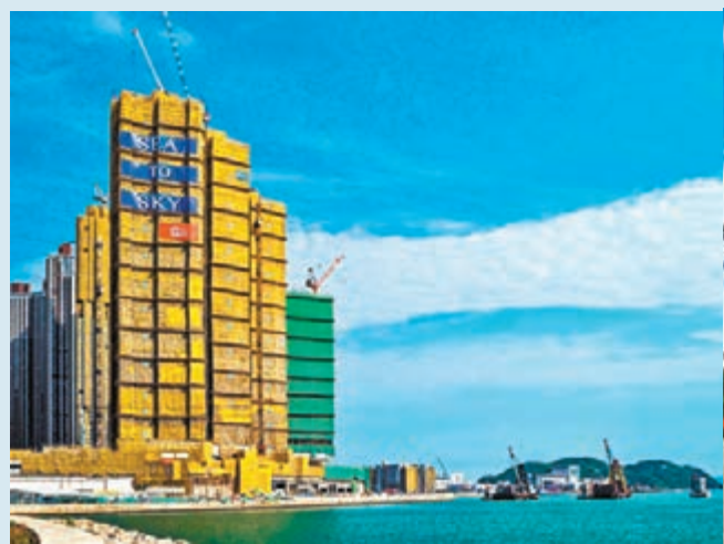
■ 日出康城 SEA TO SKY 今日開售 285 伙。