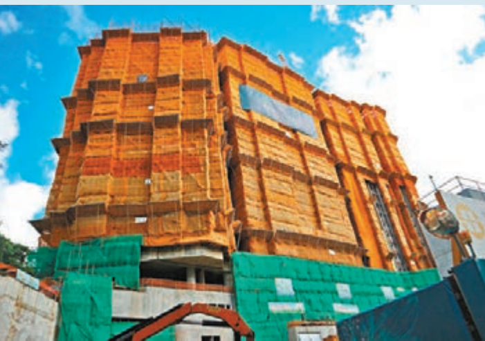
■ 茶果嶺 KOKO HILLS 今日發售 165 伙。

長實地產投資董事郭子威表示，滿意日出康城 SEA TO SKY 今次認購入票反應表現，因應疫情關係，作為該盤售樓處的紅磡置富都會商場已於昨日中午、昨晚及今早進行三次消毒工作，希望給予出席的客戶信心，相信今天的選購會順利完成。