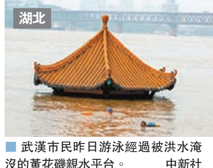
湖北 武漢市民昨日游泳經過被洪水淹沒的黃花磯親水平台。

香港文匯報訊 據中新社報道，10日從江西省應急管理廳獲悉，位於江西省上饒市鄱陽縣境內的萬畝圩堤中洲圩遭超標準洪水後9日晚發生潰堤，目前已轉移8,000多人並妥善安置，未發生傷亡。江西省應急管理廳決定自10日10時啟動防汛救災I級應急響應。 進入7月以來，鄱陽湖水系昌江河流域普降暴雨，水位迅速上漲。7月9日，鄱陽湖中洲圩水位達到23.39米，超出警戒水位3.89米。中洲圩外河古縣渡水位高達23.43米，超出1998年最高水位0.25米。中洲圩屬萬畝圩堤內轄15個行政村，堤線長33.72公里，圩堤保護面積23.8平方公里，保護耕地2.21萬畝，保護人口3.4萬人，設計標準為十年一遇。 由於長時間浸泡，加之堤身土質差，抗滲能力弱，中洲圩被集中滲漏的穿孔水帶走大量堤身泥土，雖經奮力搶險，但最終潰堤。江西省應急管理廳稱，目前，鄱陽縣投入500餘人參與搶險救援，相關救災工作正在有序開展。