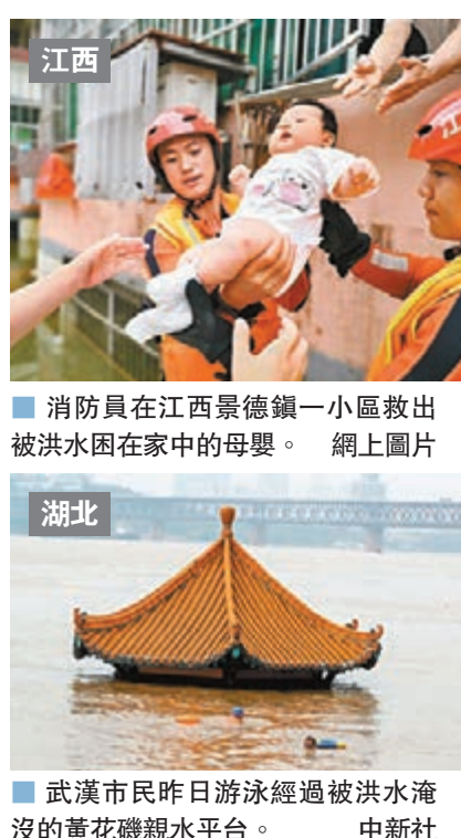
江西 消防員在江西景德鎮一小區救出被洪水困在家中的母嬰。

受近期強降雨影響，長江中下游幹流及兩湖出口控制站水位持續上漲，幹流監利以下江段、洞庭湖七里山站、鄱陽湖湖口站均已超過警戒水位。10日12時，蓮花塘、漢口、九江、湖口、大通站水位分別為33.88米、28.03米、22.03米、21.65米、15.55米。據預報，長江中下游幹流主要控制站水位將繼續上漲，部分站點將接近或超過保證水位。長江委水文局10日13時升級發布鄱陽湖湖口附近江段、鄱陽湖湖區洪水紅色預警，繼續發布長江中下游幹流城陵磯至漢口江段、大通以下江段、洞庭湖湖區、水陽江洪水橙色預警。 淮河水系將迎洪水 另據中國水利部最新預測，淮河水系可能出現明顯洪水過程。水利部要求各地有針對性安排部署洪水防禦工作。 據氣象預報，7月11日至14日，西南東部、江淮、黃淮及湖北等地將出現一次強降雨過程，其中重慶東南部、湖北東部和西南部、安徽中部北部、河南南部、江蘇中部北部等地將有100至160毫米，局部200至300毫米。 水利部預計，受其影響，貴州赤水河，重慶烏江、綦江，湖北清江、鄂東四水，安徽巢湖、滌河，江西贛江、信江、撫河，江蘇秦淮河等河流可能發生超警以上洪水。