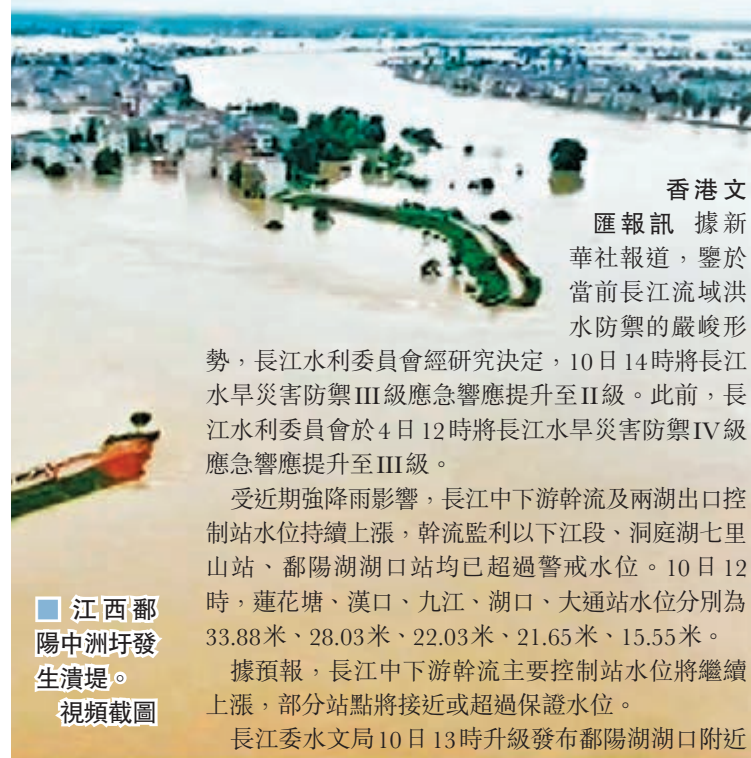
江西鄱陽湖中洲圩發生潰堤。 視頻截圖

香港文匯報訊 據新華社報道，鑒於當前長江流域洪水防禦的嚴峻形勢，長江水利委員會經研究決定，10日14時將長江水旱災害防禦III級應急響應提升至II級。此前，長江水利委員會於4日12時將長江水旱災害防禦IV級應急響應提升至III級。