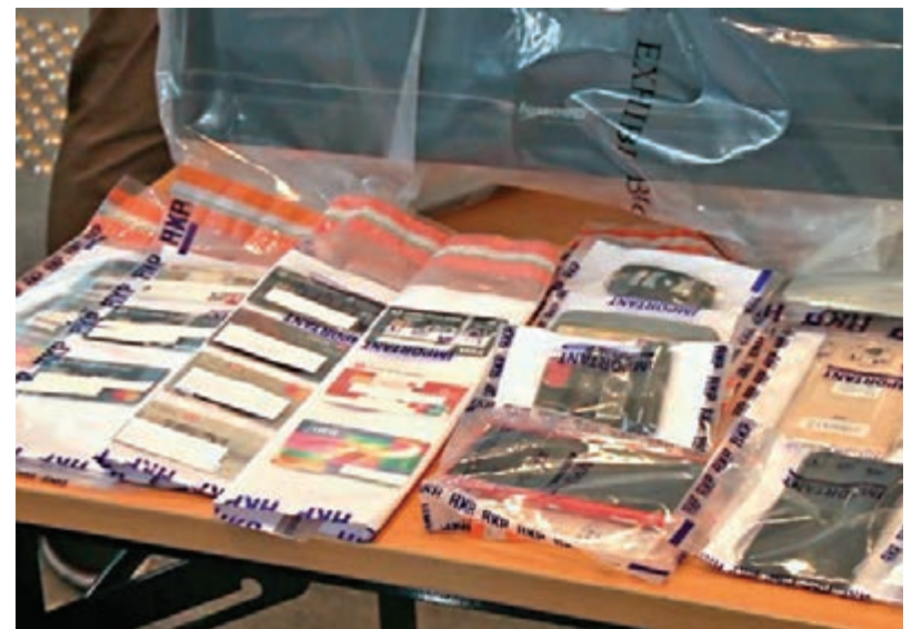
刺警案疑犯案發當晚在機場被捕。