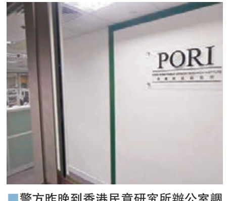
警方昨晚到香港民意研究所辦公室調查電腦是否遭駭客入侵導致有警員資料外洩。