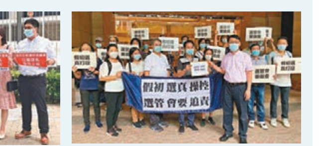
初選造成的選舉不公。