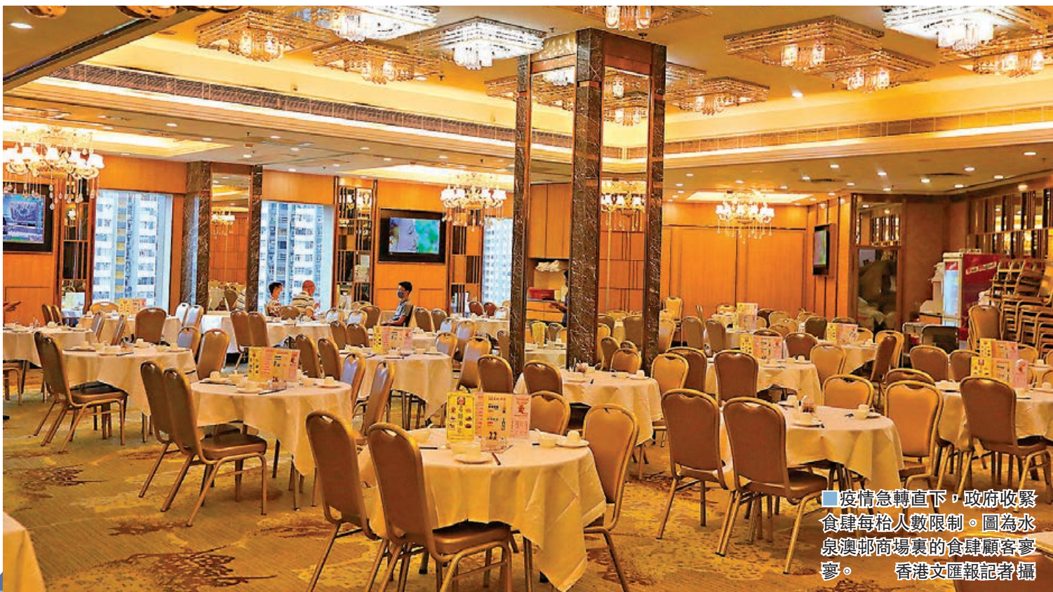
疫情急轉直下，政府收緊食肆每枱人數限制。圖為水泉澳郵商場裏的食肆顧客寥寥。