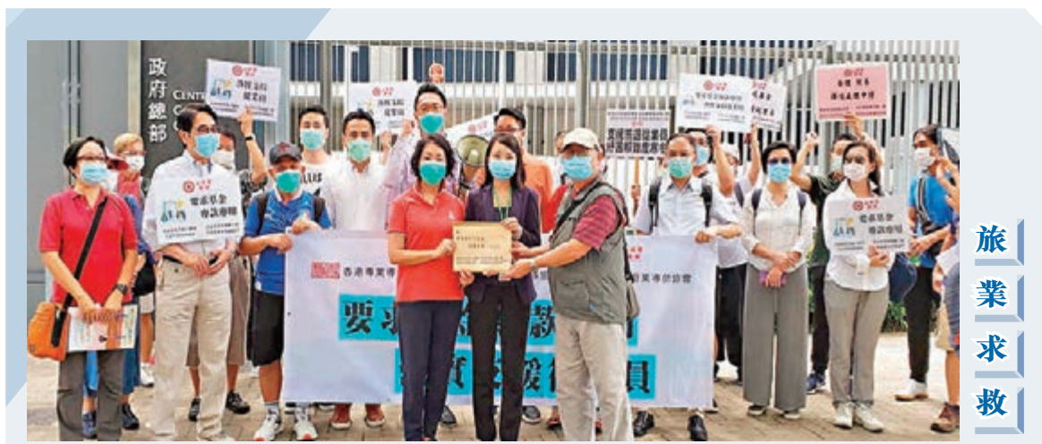
工聯會屬會香港旅遊業僱員總會、香港專業導遊總會、香港外遊領隊協會及香港旅遊業導師協會多名代表昨日到政府總部請願，指從業員受新冠病毒疫情影響，已到山窮水盡地步，惟支援從業員的旅遊業防疫抗疫基金在實施過程中卻出現不公平情況，促政府正視，並要求基金專款專用，落實支援從業員。

駿洋邨五座樓宇共有4,800多個單位，個別樓宇及單位需修繕的情況不一，按最佳估計會分兩批入伙，首批是駿時樓和駿湖樓，預計8月底陸續入伙；駿逸樓、駿爾樓及駿山樓，可能需較多修繕工作，或於10月底才陸續入伙。