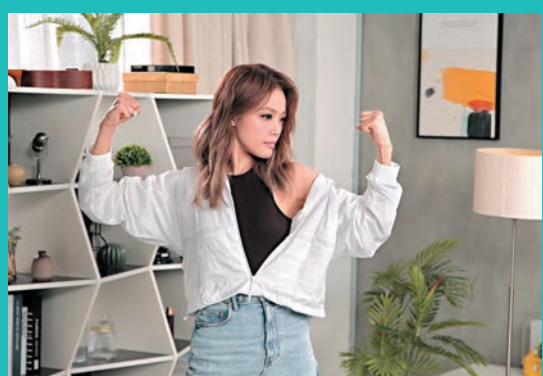
容祖兒相信艱難的時刻會過去的，要保持正面。

香港文匯報訊（記者 李思穎）李克勤剛推出的全新廣東歌曲《格林童話》噱盡多個「非常」，甚至乎這個MV都一樣「非常難拍」，採用一鏡到尾的拍攝手法，向難度挑戰，事前要排練過百次。 李克勤透露：「MV是與導演莊少榮一起構思，因為希望每一次的MV都有一些特別東西呈現出來，一鏡到尾的拍攝手法並非由我帶頭做，但今次最特別地方，例如在一個場景入面，大家會見到我同女主角有對手戲，鏡頭一轉到下一個場景女主角已經換好晒衫坐着，所以特地找來兩位女主角去演繹這一個比較特別的一鏡到尾拍攝，她們都是舞台劇演員嘛。」 問到拍攝最困難的地方時，克勤坦言是與時間競賽：「在一個好狹小嘅空間入面，其實我哋轉過好多次景，每一個人要換好多次衫，我都好換咗6、7次衫，兩位女主角都係。仲有走位，道具搬來搬去，你會發覺成日在這個狹小空間裏面，都有成二三十人走來走去！畢竟在大家走來走去之際，鏡頭只拍到演員，拍不到工作人員，所以攝影隊真的很辛苦呢！」