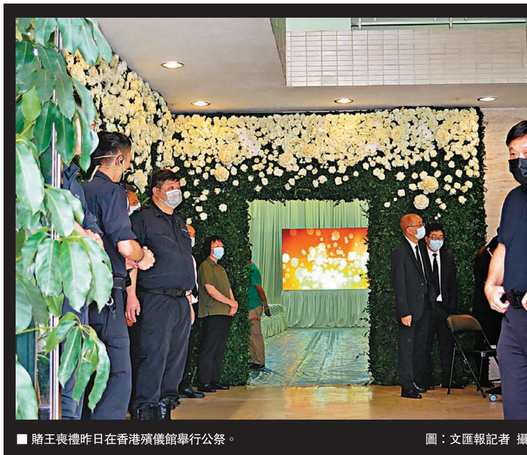
賭王喪禮昨日在香港殯儀館舉行公祭。