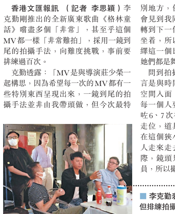
李克勤表示歌曲全長約4分鐘左右，但排練拍攝的次數達一百多次。

香港文匯報訊（記者 李思穎）李克勤剛推出的全新廣東歌曲《格林童話》噱盡多個「非常」，甚至乎這個MV都一樣「非常難拍」，採用一鏡到尾的拍攝手法，向難度挑戰，事前要排練過百次。 李克勤透露：「MV是與導演莊少榮一起構思，因為希望每一次的MV都有一些特別東西呈現出來，一鏡到尾的拍攝手法並非由我帶頭做，但今次最特別地方，例如在一個場景入面，大家會見到我同女主角有對手戲，鏡頭一轉到下一個場景女主角已經換好晒衫坐着，所以特地找來兩位女主角去演繹這一個比較特別的一鏡到尾拍攝，她們都是舞台劇演員嘛。」 問到拍攝最困難的地方時，克勤坦言是與時間競賽：「在一個好狹小嘅空間入面，其實我哋轉過好多次景，每一個人要換好多次衫，我都好換咗6、7次衫，兩位女主角都係。仲有走位，道具搬來搬去，你會發覺成日在這個狹小空間裏面，都有成二三十人走來走去！畢竟在大家走來走去之際，鏡頭只拍到演員，拍不到工作人員，所以攝影隊真的很辛苦呢！」