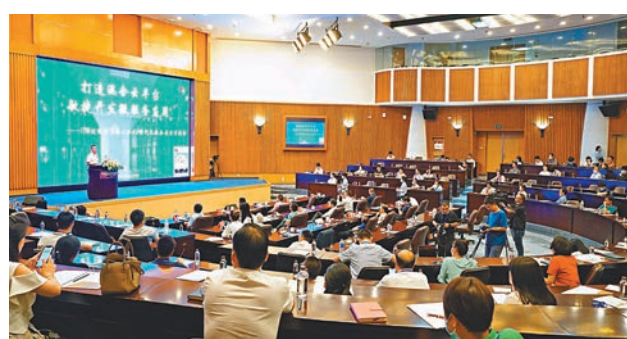
「台交會」之「2020海峽兩岸經貿論壇」邀請兩岸知名專家、學者、企業精英進行面對面交流。