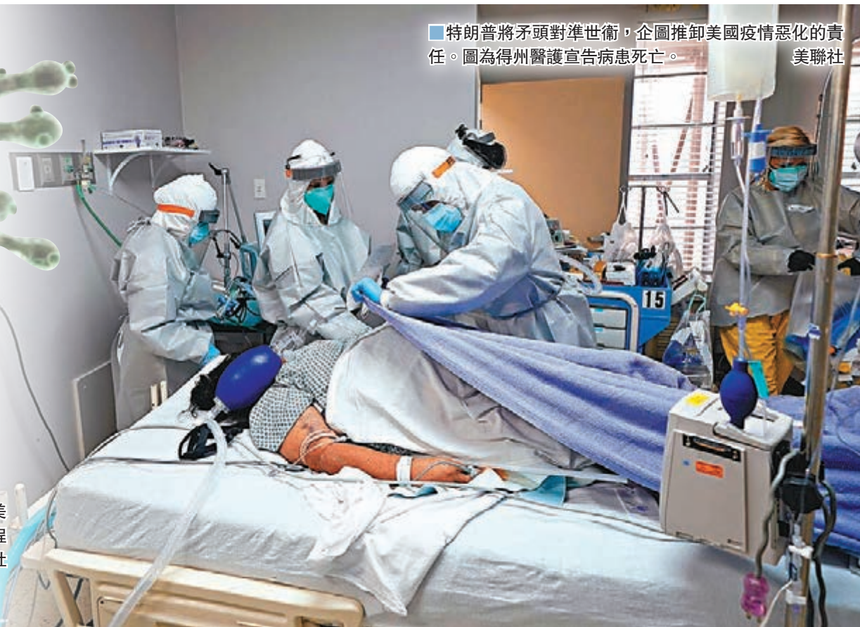
■ 特朗普將矛頭對準世衛，企圖推卸美國疫情惡化的責任。圖為得州醫護宣告病患死亡。