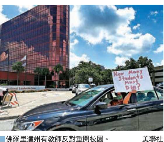
■ 佛羅里達州有教師反對重開校園。