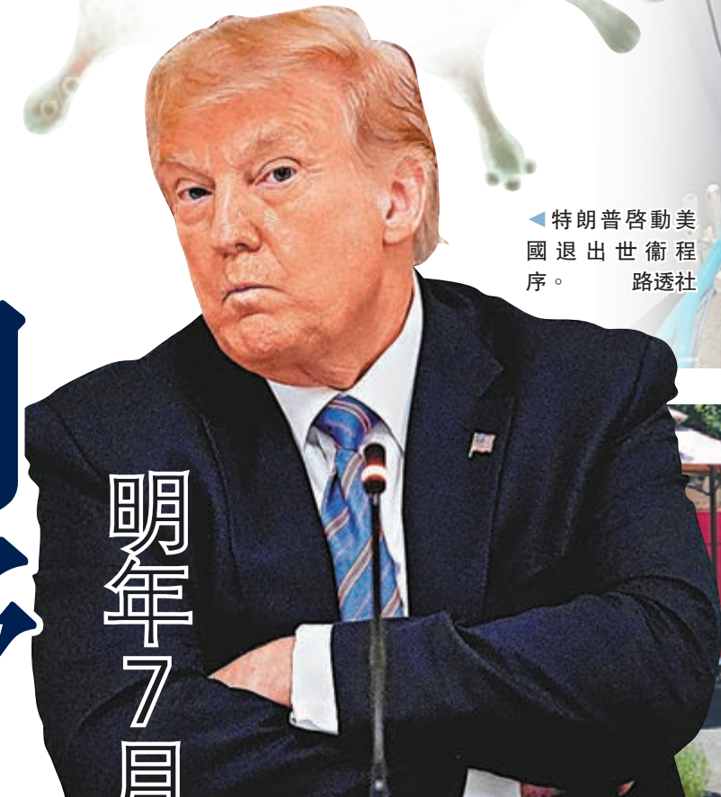
▶ 特朗普啟動美國退出世衛程序。