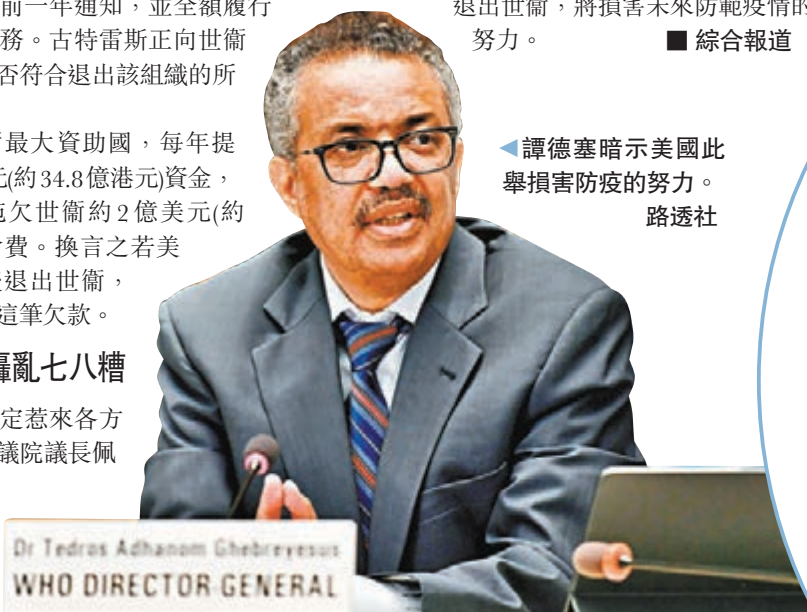
Dr. Tedros Adhanom Ghebreyesus WHO DIRECTOR GENERAL