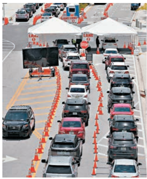
■ 邁阿密眾多駕駛人士等待檢測。

正當美國的新冠肺炎疫情進一步惡化、總統特朗普防疫不力持續受批評之際，美國國務院發言人證實，特朗普周一正式致函通知聯合國秘書長古特雷斯，稱美國將退出世界衛生組織，明年7月6日正式生效。美國朝野以至公共衛生專家齊聲炮轟特朗普的決定，國會民主黨人指責特朗普此舉「放棄美國作為全球領導者的角色」。民主黨準總統候選人拜登表明，一旦他當選總統，美國將重新加入世衛。