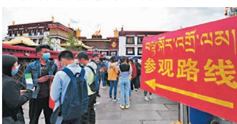
7月3日，遊客在拉薩大昭寺入口處排隊等待參觀。

統計，2015年至2018年，西藏方面就已接待進行公務、旅遊、商務等活動的外國朋友近17萬6千人次。其中，遊客17萬5千人次，外交官約500人次，記者343人次。去年，西藏全年接待國內外遊客更是突破4,000萬人次，美國駐華大使布蘭斯塔德也於去年赴藏參訪，同自治區人民政府多個部門座談，有關報道在媒體上都可以看到。這充分說明外國人進藏不存在問題。