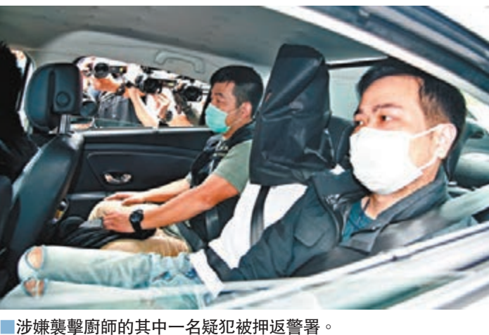
涉嫌襲擊廚師的其中一名疑犯被押返警署。

香港文匯報訊(記者 蕭景源)「龍門冰室」退出所謂的「黃色經濟圈」7天，本周一尖沙咀分店的廚師在店外遇襲，黃煤和黃絲即如獲至寶，聲稱該店因為「退圈」被威嚇、被打壓。警方重案組迅速鎖定疑兇身份，分別在案發當晚和前日拘捕兩名男子，其中一人是該店前員工，疑與傷者因工作糾紛結怨，故結黨尋仇，相信伏擊廚師與該店的「顏色」無關。警方指出，仍在追緝其