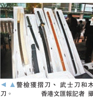
▲警檢獲摺刀、武士刀和木刀。