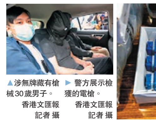
▲涉無牌藏有槍械30歲男子。