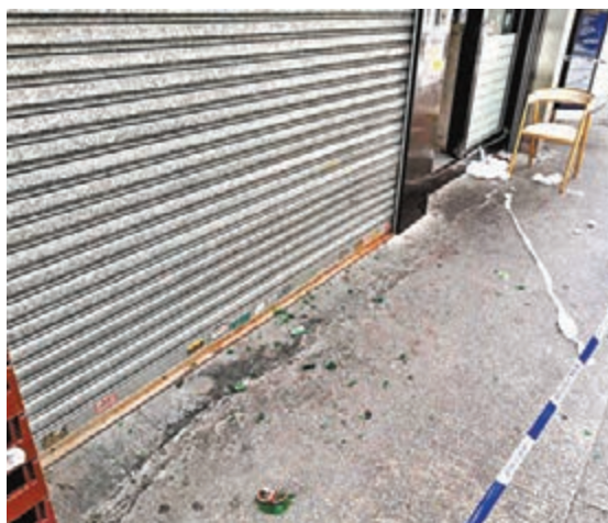
襲擊廚師現場血跡斑斑。