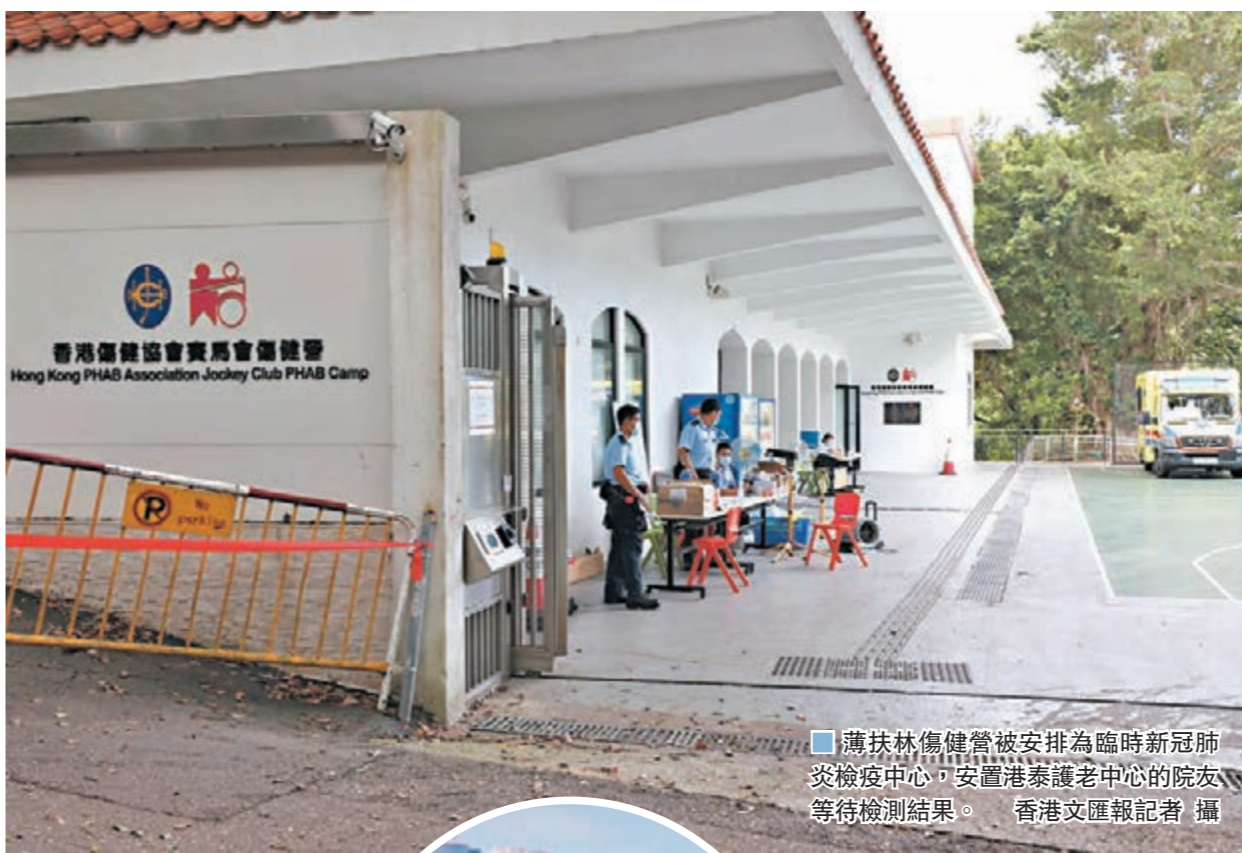
薄扶林傷健營被安排為臨時新冠肺炎檢核中心,安置港泰護老中心的院友等待檢測結果。