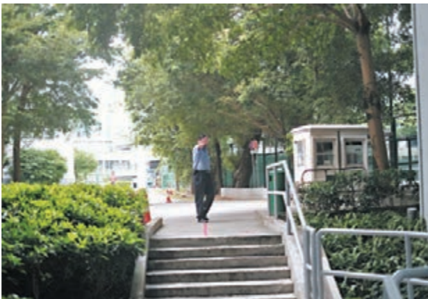
「男拔」停課,職員拒絕採訪。