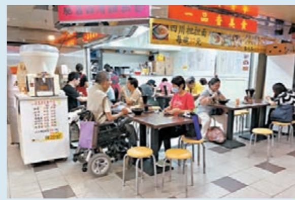
食肆餐枱擺得密且無隔板,食客可隨意搭枱。