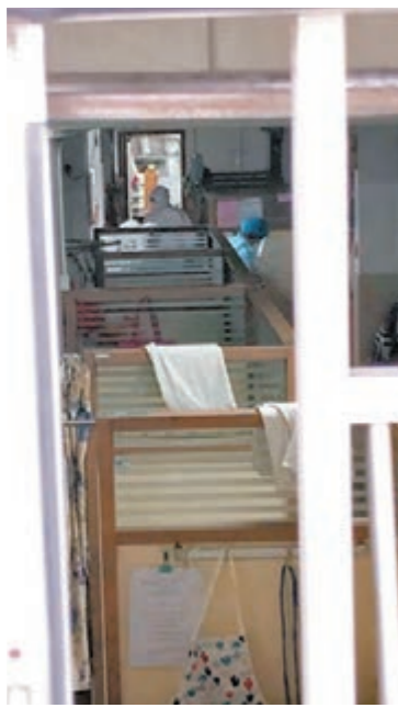
港泰護老院內有職員在消毒。