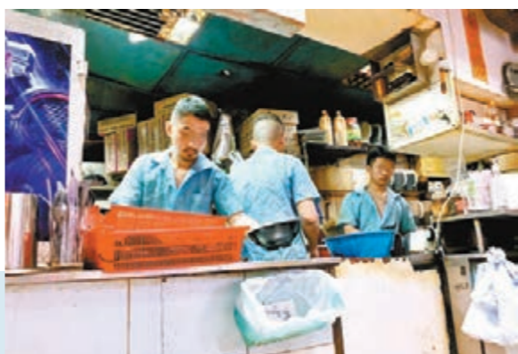
廚師和水吧員工都沒有戴口罩,又不停聊天,口沫橫飛。