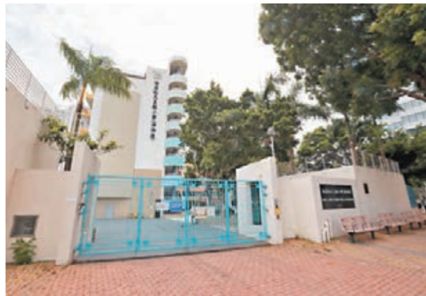
油蔴地天主教小學(海泓道)停課。