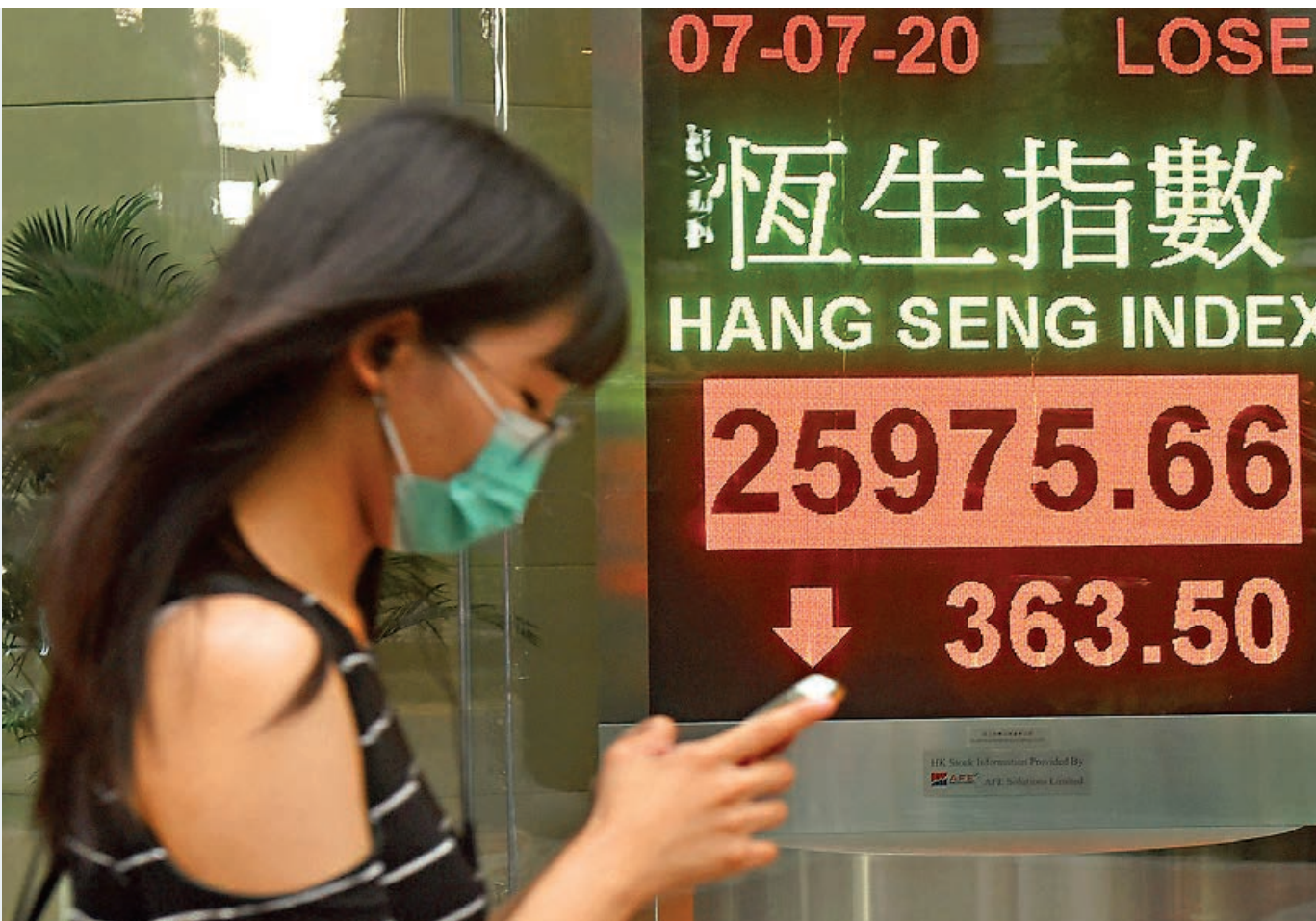
■恒生指數昨報25,975點，下跌363點或1.38%，中止了近期連日升勢，惟單日成交金額超過2,000億元，反映市場成交異常活躍。同時，資金持續流入港元，引發金管局連日入市沽港元。

港匯強勢，與新股市場活躍有關，海普瑞(9989)今天上市，昨日的暗盤表現一般，於耀才的暗盤市場收報18.58元，較招股價18.4元微高1%。該股在富途的暗盤市場，則報19.02元，有3.4%的升幅。