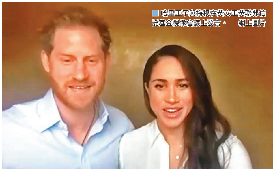
哈里王子與梅根在英女王英聯邦信託基金視像會議上發言。

英國哈里王子與妻子梅根上週三在英女王英聯邦信託基金視像會議上發言，敦促英聯邦承認過往「令人不快」的殖民歷史，並改正錯誤，以處理種族歧視問題。哈里與梅根雖已卸下高級王室成員身份，但因會議場合涉及英聯邦，有英國議員批評哈里發言等同干涉政治，更可能令英女王不滿。