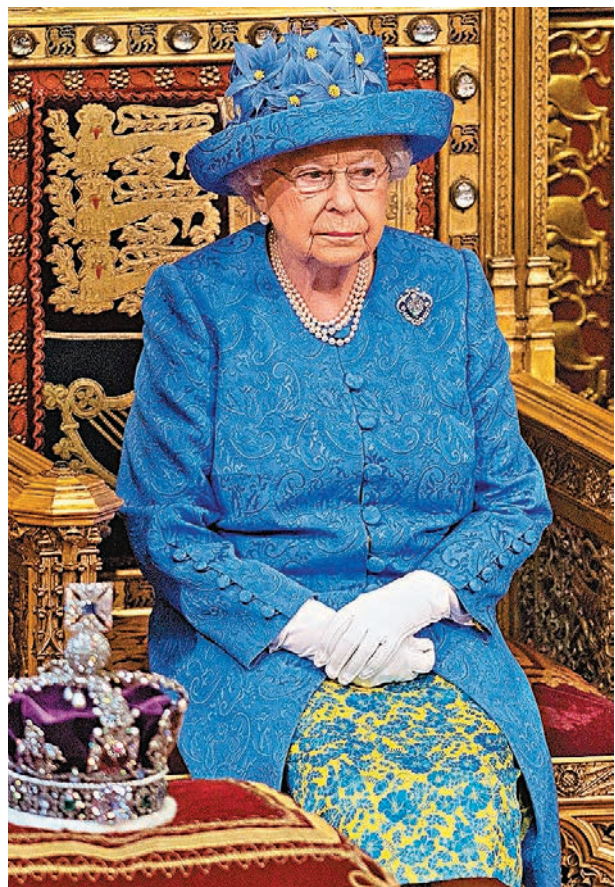
英國議員批評哈里發言等同干涉政治，更可能令英女王不滿。

英國哈里王子與妻子梅根上週三在英女王英聯邦信託基金視像會議上發言，敦促英聯邦承認過往「令人不快」的殖民歷史，並改正錯誤，以處理種族歧視問題。哈里與梅根雖已卸下高級王室成員身份，但因會議場合涉及英聯邦，有英國議員批評哈里發言等同干涉政治，更可能令英女王不滿。