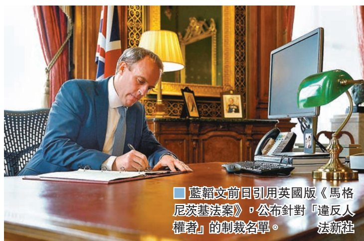
藍翰文前日引用英國版《馬格尼茨基法案》，公布針對「違反人權者」的制裁名單。

英國外相藍翰文前日引用英國版《馬格尼茨基法案》，公布針對「違反人權者」的制裁名單，當中包括俄羅斯、沙特阿拉伯、緬甸及朝鮮的個人或組織。俄國政府昨日譴責英方的舉動「不友善」，表示將採取相應的制裁措施作反擊。