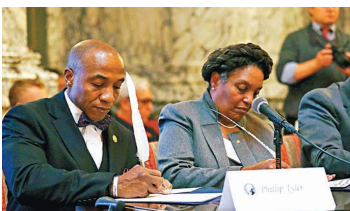
在2016年上屆大選中，有5名選舉人拒絕按照普選票結果，投給候選人。 網上圖片