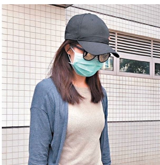
前空姐用鐳射筆射警眼罪成判囚3個月,准保釋候上訴。