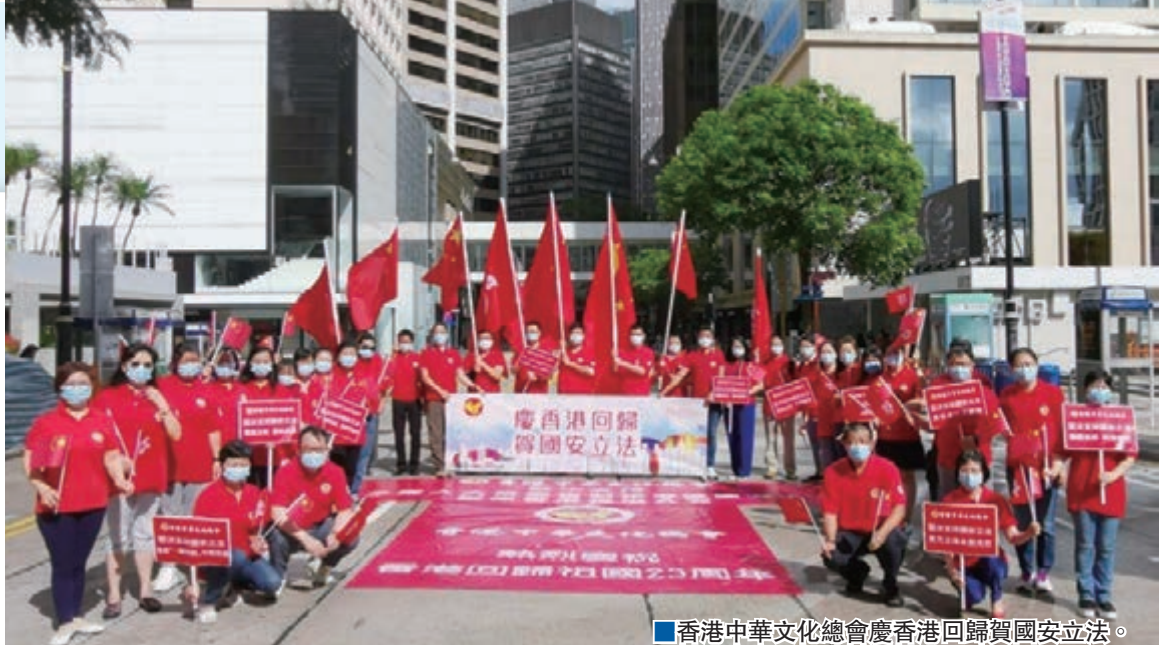
香港中華文化總會慶香港回歸賀國安立法。

文化總會代表們唱畢國歌，興高采烈地揮動國旗和區旗，並高舉各種支持國安立法的手舉牌拍照。大家舉起「堅決支持國安立法，推進『一國兩制』行穩致遠」、「堅決支持國安立法，維護香港繁榮穩定」、「堅決支持國安立法，保障市民合法權利」、「堅決支持國安立法，嚴懲漢奸賣國賊」、「堅決支持國安立法，保『一國兩制』還香港穩定」的舉牌，萬分激動，高漲的情緒感染了路人，紛紛用手機拍下這一珍貴的畫面。