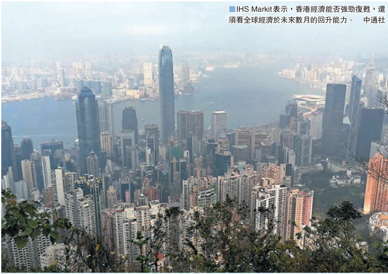
IHS Markit表示，香港經濟能否強勁復甦，還須看全球經濟於未來數月的回升能力。

正當經濟顯示初步的復甦跡象，勞動力市場基本已穩定下來，絕大多數的受訪公司表示，其聘僱水平維持不變。企業6月對經營前景的負面情緒較上月輕微，信心度回復至5個月高位；惟因企業憂慮疫情對經濟活動的長遠影響存在不確定性，整體的營商氣氛依然疲弱。此外，由於採購品的價格通脹超越了員工成本的跌幅，企業6月整體成本負擔較上月加重。