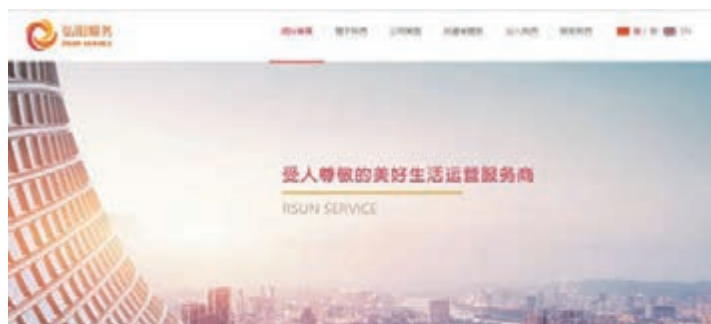
弘陽服務集團將今早掛牌上市。其一手中籤率30%，抽100手方可獲獲一手。

香港文匯報訊（記者 岑健樂）內地物業管理公司弘陽服務集團（1971）於今早掛牌上市。據輝立交易場的數據顯示，該股暗盤價昨日收報4.88元，較招股價升17.59%，以一手1,000股計算，不計手續費每手賬面賺730元。另一方面，港交所（0388）昨日推出首批10隻以美元計價MSCI指數期貨合約。