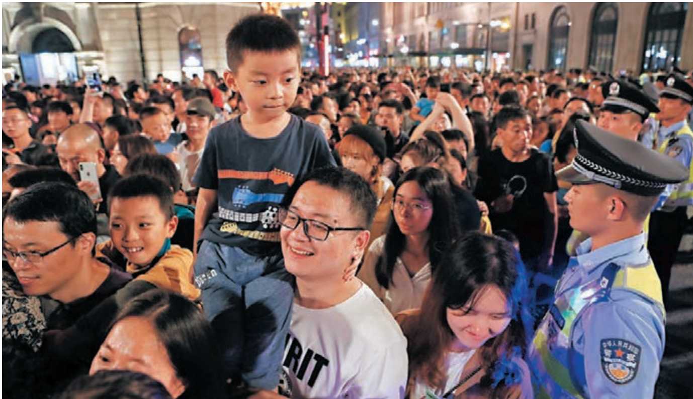
《中國經濟生活大調查（2019—2020）》結果顯示，過去一年有43.81%的受訪者感覺自己幸福。圖為早前市民在上海外灘遊覽。

《中國經濟生活大調查》連續14年通過郵遞員每年向公眾發放十萬張調查問卷，今年在國航、南航和東航的大力支持下又開闢了新的空中調查渠道，調查問卷走進了機艙，十三萬張問卷呈現出了更加豐富生動的中國百姓畫像。