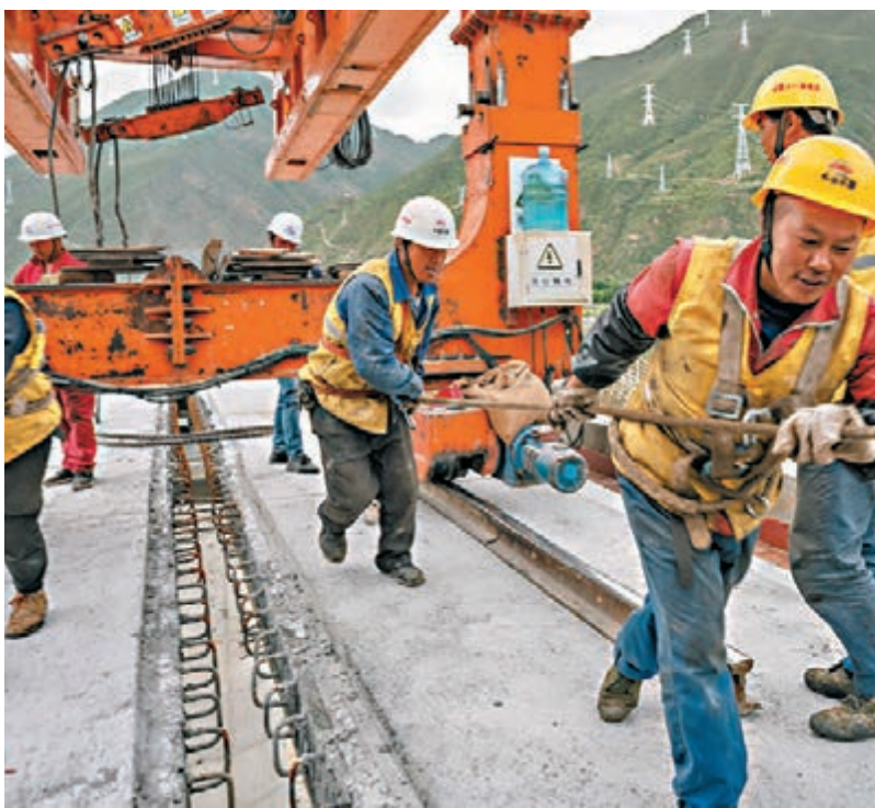
截至7月1日，鐵路新線開通1,178公里，其中高鐵605公里。圖為7月4日，西藏拉林鐵路加查1號雅魯藏布江特大桥順利完成橋樑架設任務。

負責人表示，今年上半年，國鐵集團服務國家發展戰略，優先安排川藏鐵路、沿江高鐵、西寧至成都鐵路等重點項目前期工作，保證了前期工作進展和質量；鄭州至濟南高鐵山東段、上海至蘇州至湖州鐵路、阿克蘇至阿拉爾鐵路等12個項目順利開工建設；拉薩至林芝鐵路、北京至瀋陽高鐵京冀段、太原至焦作高鐵、連雲港至徐州高鐵、贛州至深圳高鐵、貴陽至南寧高鐵、和田至若羌鐵路、大理至瑞麗鐵路等在在建項目取得重大進展。同時，計劃今年下半年開通的銀川至西安高鐵、北京至雄安新区際鐵路河北段、合肥至安慶高鐵、淮安至鎮江鐵路等一批重點項目正有序推進，將按期開通，預計今年開通鐵路新線4,400公里左右，其中高鐵2,300公里左右。