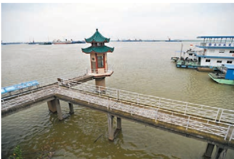
7月5日16時，洞庭湖城陵磯水位達到32.75米，超警戒水位0.25米。

這兩天，江西奉新縣出現強降雨，赤田鎮段里村多戶村民家中進水。當地正在對受困人員進行救援轉移。安徽宣城龍川村，多名群眾被困，其中包括一名4歲兒童和一名90歲高齡的老人。由於老人行動不便，消防員用棉被給老人做了一個臨時擔架，隨同其他村民開始一起轉移。7個小時後，消防人員成功將18名村民轉移到安全地帶。