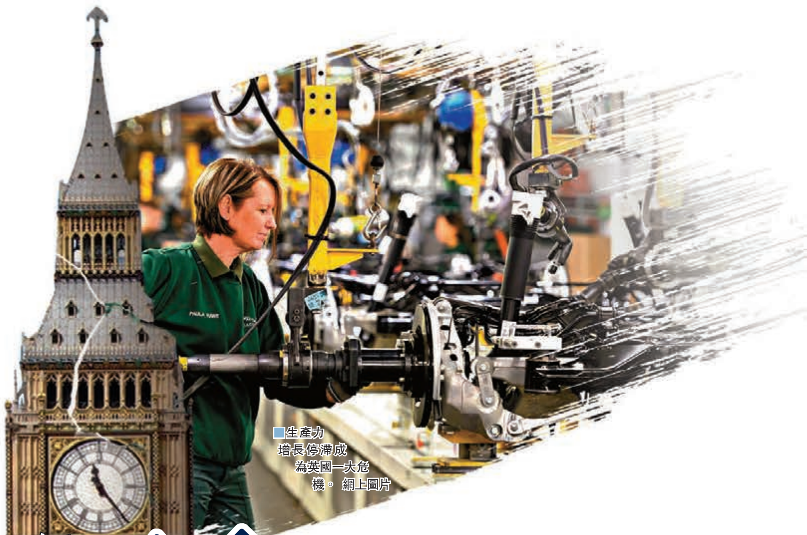
生產力增長停滯成為英國一大危機。網上圖片