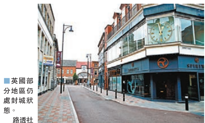
英國部分地區仍處封城狀態。

「殭屍企業」一詞最早於1990年代日本資產泡沫時期出現，用作形容未還清債務的公司，它們的盈利僅夠繳付債務利息，無法償還本金，意味不斷要靠借錢來維持營運。由於公司有償還利息，銀行無法中止貸款，令公司可以繼續生存，但卻沒有足夠資金投資；當殭屍企業愈來愈多，將窒礙整體經濟發展。