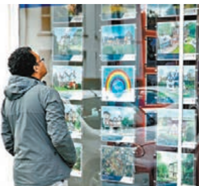
英國租金有升無跌。