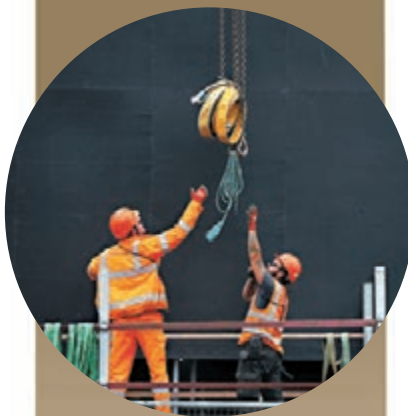
英國低技術青年的比例高。